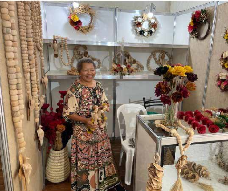
Serão 35 estandes, além de atrações culturais e oficinas

Que tal contribuir com o fortalecimento do trabalho artesanal no estado? Neste sábado e domingo (18 e 19/3), Goiânia recebe a segunda edição da Goiás Feito à Mão – Feira de Artesanato e Economia Criativa do Colégio Tecnológico (Cotec) , que terá cerca de 35 estandes com exposição e venda de produtos, atrações culturais, praça de alimentação e espaço para a