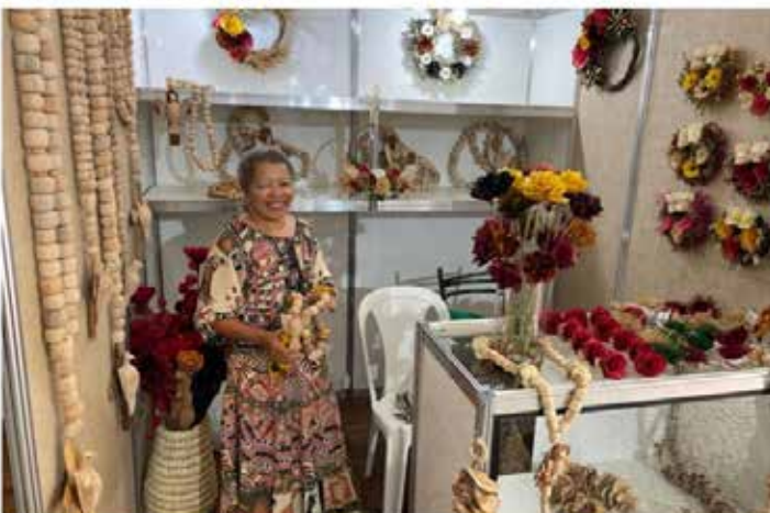
Feira de Artesanato e Economia Criativa do Cotec terá bancas de artesanato, atrações culturais e espaços de lazer para crianças no sábado, 18, e domingo, 19.

Feira terá 35 estandes montados em estrutura coberta, além de atrações culturais, espaço para crianças, praça de alimentação e oficinas gratuitas com artesãos de renome nacional