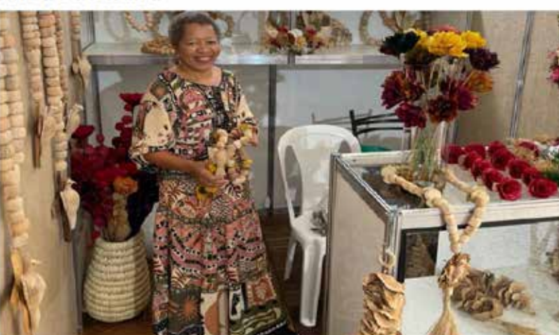
Feira terá 35 estandes montados em estrutura coberta, além de atrações culturais, espaço para crianças, praça de alimentação e oficinas gratuitas com artesãs de renome nacional

O Governo de Goiás, por meio da Secretaria da Retomada, promove a segunda edição da Goiás Feito à Mão - Feira de Artesanato e Economia Criativa do Colégio Tecnológico (Cotec) neste fim de semana (18 e 19/03), na Praça Cívica, em Goiânia. Além de 35 estandes com exposição e venda de trabalhos artesanais, o público poderá assistir a atrações culturais e aproveitar a praça de alimentação e o espaço para crianças, com gibiteca e brinquedos infláveis.