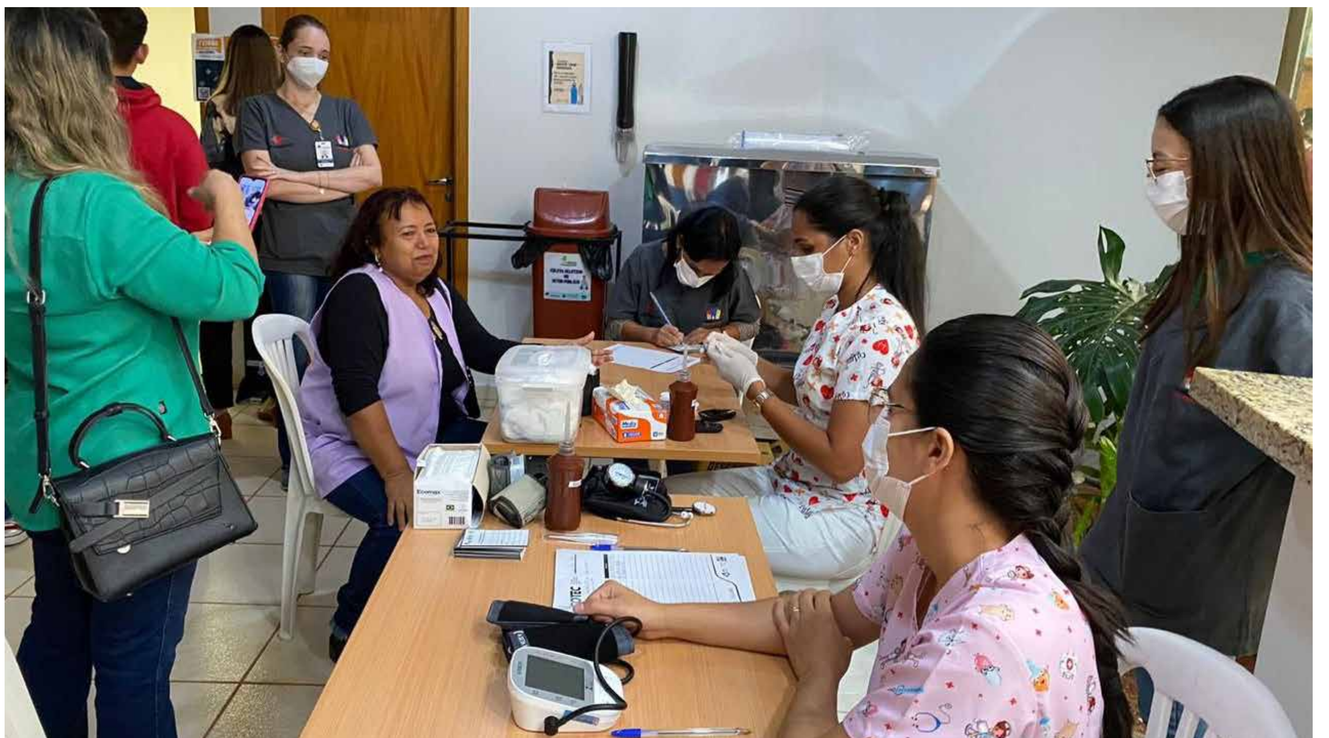
Palmeiras de Goiás