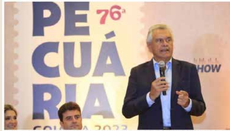
Legenda: Governador Ronaldo Caiado durante lançamento da 76ª Exposição Agropecuária do Estado de Goiás: "Aqui se faz agropecuária com base científica"

Festa ocorre entre os dias 18 e 28 de maio, no Parque de Exposições do Setor Nova Vila, em Goiânia. Edição 2023 marca retorno de grandes shows à programação.