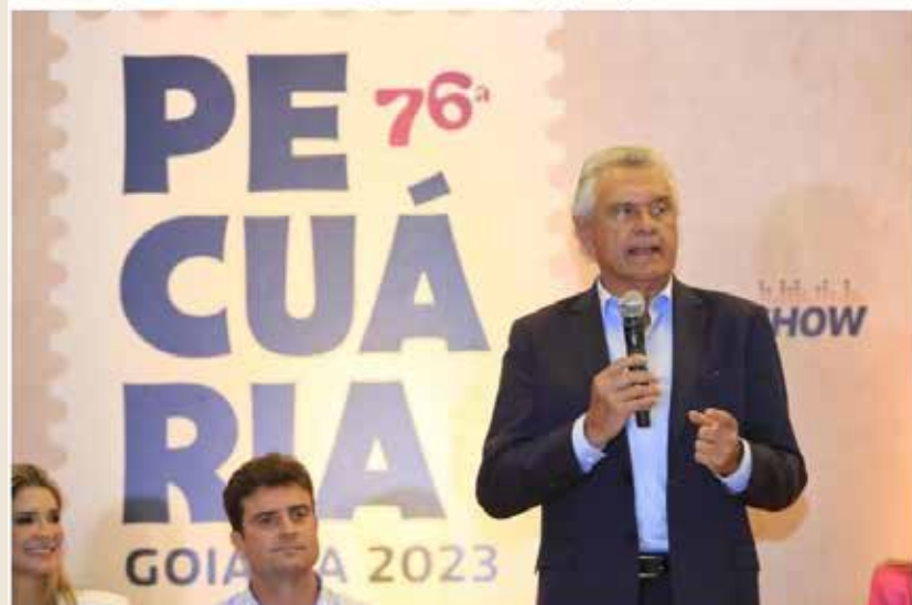
Governador Ronaldo Caiado durante lançamento da 76ª Exposição Agropecuária do Estado de Goiás: "Aqui se faz agropecuária com base científica".

Festa ocorre entre os dias 18 e 28 de maio, no Parque de Exposições do Setor Nova Vila, em Goiânia. Edição 2023 marca retorno de grandes shows à programação