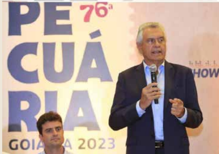
Festa ocorre entre os dias 18 e 28 de maio, no Parque de Exposições do Setor Nova Vila, em Goiânia. Edição 2023 marca retorno de grandes shows à programação.

Além do retorno de grandes shows à programação, a 76ª Exposição Agropecuária do Estado de Goiás traz entre as novidades cursos técnicos em agroecologia, zootecnia, agropecuária e agricultura, realizados em parceria com o Governo do Estado, por meio da Secretaria da Retomada. "Não é cursinho para dar diploma, é curso para dar preparo às pessoas, que vão sair daqui realmente qualificadas", disse o governador Ronaldo Caiado ao participar do lançamento da Exposição, em Goiânia, na noite desta segunda-feira (13/03).