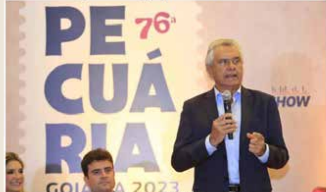
Ronaldo Caiado, em frente ao lançamento de Pecuária 2023

Além do retorno de grandes shows à programação, a 76ª Exposição Agropecuária do Estado de Goiás traz entre as novidades cursos técnicos em agroecologia, zootecnia, agropecuária e agricultura, realizados em parceria com o Governo do Estado, por meio da Secretaria da Retomada. O anúncio foi feito pelo governador Ronaldo Caiado (União Brasil), na noite desta segunda-feira (13/03).