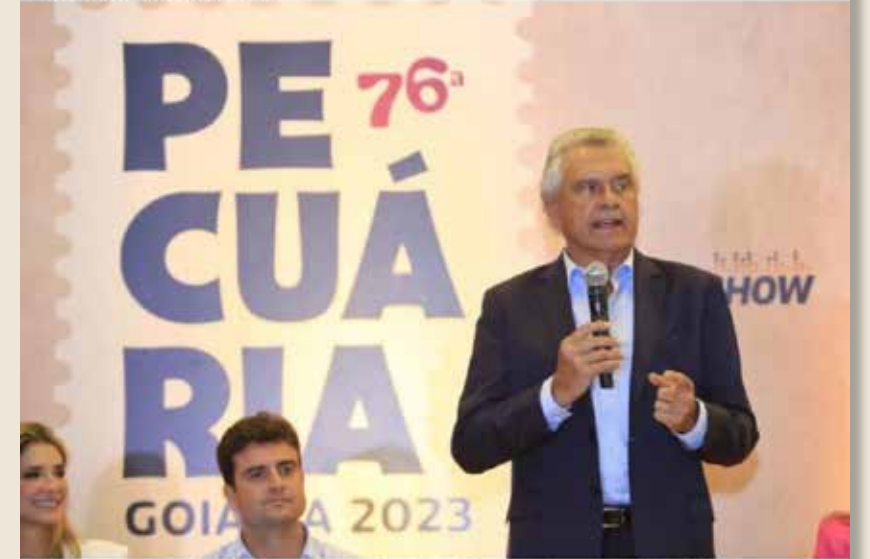
Festa ocorre entre os dias 18 e 28 de maio, no Parque de Exposições do Setor Nova Vila, em Goiânia. Edição 2023 marca retorno de grandes shows à programação.

Além do retorno de grandes shows à programação, a 76ª Exposição Agropecuária do Estado de Goiás traz entre as novidades cursos técnicos em agroecologia, zootecnia, agropecuária e agricultura, realizados em parceria com o Governo do Estado, por meio da Secretaria da Retomada. "Não é cursinho para dar diploma, é curso para dar preparo às pessoas, que vão sair daqui realmente qualificadas", disse o governador Ronaldo Caiado ao participar do lançamento da Exposição, em Goiânia, na noite desta segunda-feira (13/03).