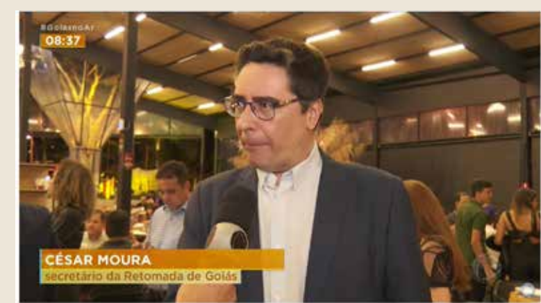
PECUÁRIA DE GOIÂNIA: MAIOR FESTA DE GOIÁS SERÁ ENTRE 18 E 28 DE MAIO

Festa será de 18 a 28 de maio, no Parque de Exposições do Setor Nova Vila, em Goiânia. Edição 2023 marca retorno de grandes shows à programação. Os cursos técnicos são para agroecologia, zootecnia, agropecuária e agricultura além do retorno de grandes shows à programação, a 76ª Exposição Agropecuária do Estado de Goiás traz entre as novidades cursos técnicos em agroecologia, zootecnia, agropecuária e agricultura, realizados em parceria com o Governo do Estado, por meio da Secretaria da Retomada. "Não é cursinho para dar diploma, é curso para dar preparo às pessoas, que vão sair daqui realmente qualificadas", disse o governador Ronaldo Caiado ao participar do lançamento da Exposição, em Goiânia, na noite desta segunda-feira (13/03).