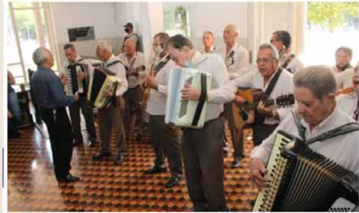
Visitors se apresentam na Feira Goiás Feito à Mão, na Praça Cívica, em Goiânia

Nos dias 18 e 19 de março, a Praça Cívica, em Goiânia, receberá a Feira de Artesanato Goiás Feito à Mão, que dispõe de inúmeros produtos de artesanato, decoração e gastronomia, além de atendimento ao artesão e apresentações culturais. No sábado (18), os atrativos estarão disponíveis das 9h às 16h e no domingo (19), das 8h às 12h.