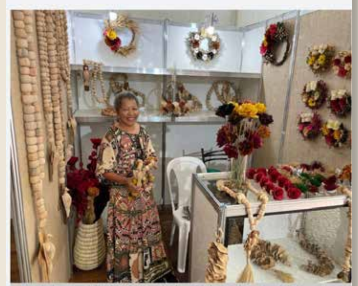
Feira de artesanato Goiás Feito à Mão inaugura e fortalece o efeito de atração.

Em Goiás, já são mais de 10 mil trabalhadores cadastrados na plataforma do Sistema de Informações Cadastrais de Artesanato Brasileiros (Sicab)