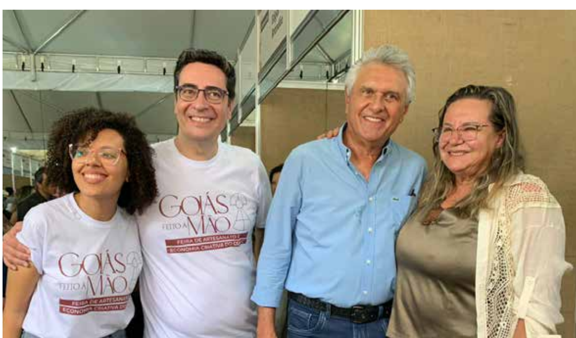
Oficina da Fatinha