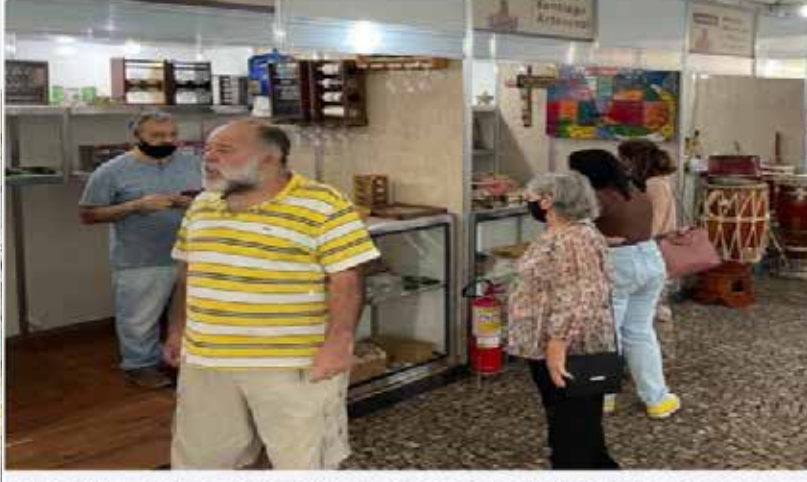
Feira de Artesanato oferece atrações culturais na Praça Cívica neste fim de semana

Feira de Artesanato e Economia Criativa do Cotec terá bancas de artesanatos, atrações culturais e espaços de lazer para crianças no sábado (18/03) e domingo (19)