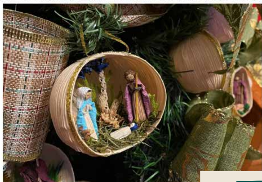
A iniciativa é uma oportunidade de presentear neste Natal com peças produzidas por artistas goianos

Neste sábado (10/12) começa a primeira edição da feira de artesanato goiano "Goiás Feito à Mão". Os trabalhos artesanais estarão expostos e disponíveis para venda das 8h às 12h, na Praça Cívica, próximo à Avenida 85. A iniciativa é uma oportunidade de presentear neste Natal com peças produzidas por artistas goianos.