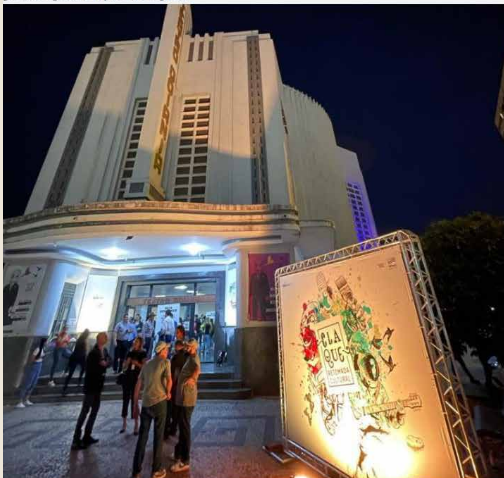
Projeto terá investimento de R$ 20 milhões ao todo

Iniciativa entre Secretaria de Retomada e Sesc tiveram um investimento de R$ 3,9 milhões para as apresentações na capital