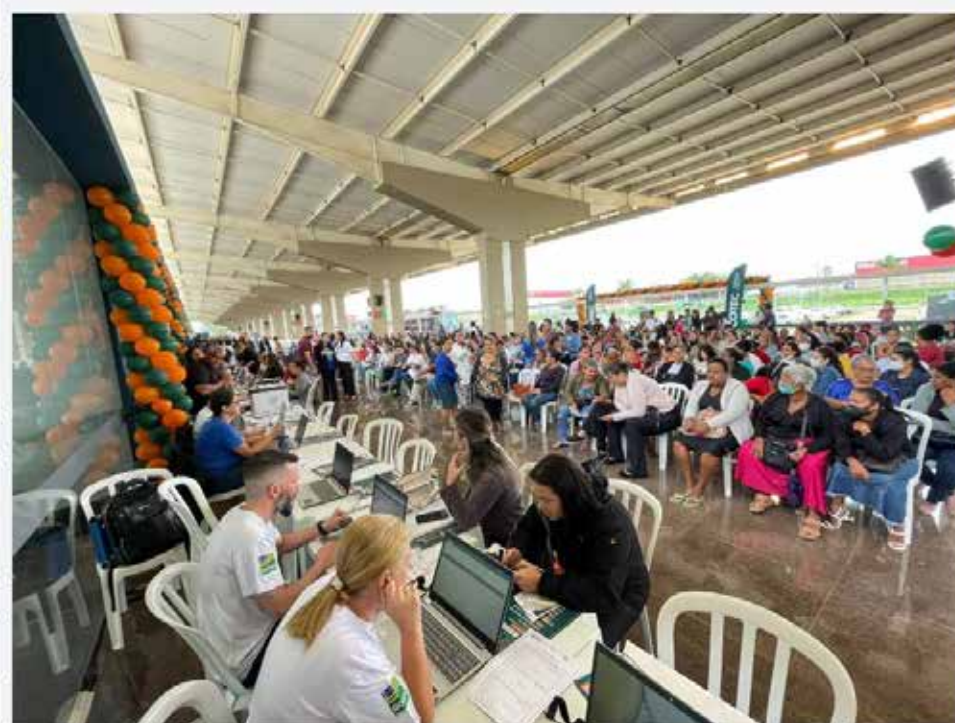
Governo de Goiás realiza mais de 9 mil atendimentos durante Feirão de Empregos do Cotec em Anápolis

Evento realizado no Centro de Convenções do município ofertou 5 mil vagas de trabalho e inscrições em cursos profissionalizantes, além de entregar benefícios sociais do Governo de Goiás. Prefeitura, Seds, GPS, GoiásFomento, Sebrae e Adial são parceiros da ação