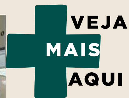
#Jornalismo #Goiás #Goiânia FOI REALIZADA A PRIMEIRA EDIÇÃO DA FEIRA DE ARTESANATO GOIANO "GOIÁS FEITO À MÃO" - JBC - 10/12/2022