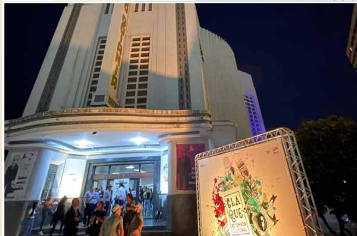
A iniciativa terá investimento total de R$ 20 milhões, sendo R$ 15 milhões do Tesouro Estadual