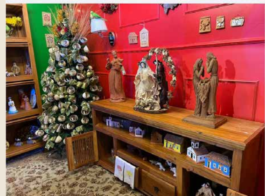
Iniciativa é uma oportunidade de presentear neste Natal com peças produzidas por artistas do nosso Estado!

Goiás Feito à Mão será realizado neste sábado, 10, com exposição e venda de peças artesanais, show sertanejo e apresentação circense