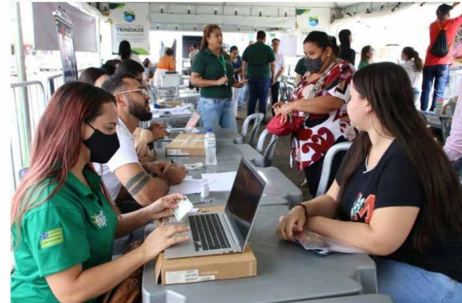
Candidatos se reúnem em busca de uma oportunidade

A Prefeitura de Trindade abriu seu 1º Feirão de Emprego com mais de 700 oportunidades. O "Seu presente é um emprego!" acontece sexta-feira (16), das 8h às 17h na Avenida Manoel Monteiro Raimundo de Aquino. Os salários vão de R$ 1.212 até R$ 4 mil e há contratações imediatas.