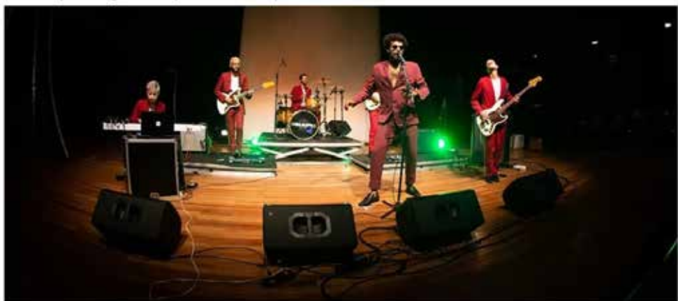
Artistas podem se inscrever para projetos em Goiânia e cidades do interior

As inscrições são gratuitas e podem ser feitas pelo site do Sesc GO