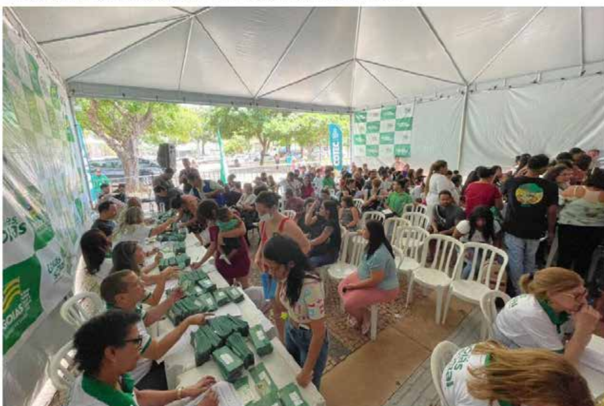
Feirão em Goiânia faz quase 13 mil atendimentos para preencher 10 mil vagas de trabalho

Feirão encerrou suas atividades neste sábado (22) após cinco dias de evento