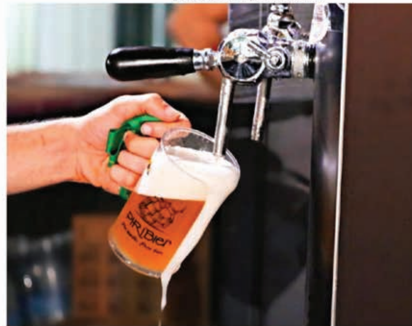
O estande do Cotec vai apresentar ainda duas marcas de cervejas feitas com fécula de mandioca e que integram o projeto de agricultura familiar

O estande do Cotec vai apresentar ainda duas marcas de cervejas feitas com fécula de mandioca e que integram o projeto de agricultura familiar