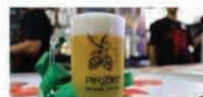
Governo oferece três opções de cursos profissionalizantes gratuitos ao público do festival PiriBier 2022, edição Goiânia

O estande do Cotec vai apresentar ainda duas marcas de cervejas feitas com fécula de mandioca e que integram o projeto de agricultura familiar. A iniciativa é promovida pelo Governo de Goiás, em parceria com a Ambev e a Cervejaria Colombina.