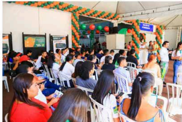
A Secretaria da Retomada realiza nesta quinta e sexta-feira (17 e 18/11) a última edição do Feirão de Empregos do Colégio Tecnológico (Cotec) em 2022. O evento será no município de Ceres, no Cotec Célio Domingos Mazzonetto, das 8h às 18h, com atendimento por ordem de chegada.

O Feirão de Empregos do Cotec, que chega à 16ª edição, tem o objetivo de facilitar o acesso da população a milhares de oportunidades de trabalho formal. Também são disponibilizadas vagas em cursos profissionalizantes gratuitos, o que contribui para o aumento da renda e independência financeira da população.