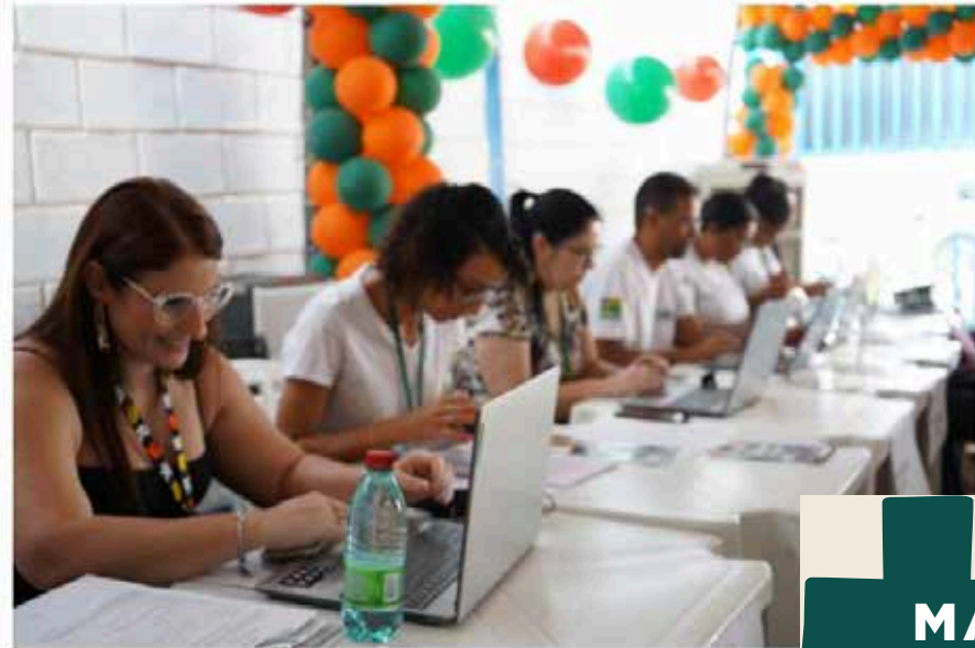
Na quinta-feira (17) e sexta-feira (18), será realizada a última edição do Feirão do Cotec em 2022. Esta é a 16ª edição do evento e será sediada no Colégio Tecnológico (Cotec) Célio Domingos Mazzonetto, na cidade de Ceres.

O evento será realizado no Colégio Tecnológico (Cotec) Célio Domingos Mazzonetto e contará com a oferta de centenas de vagas de trabalho.