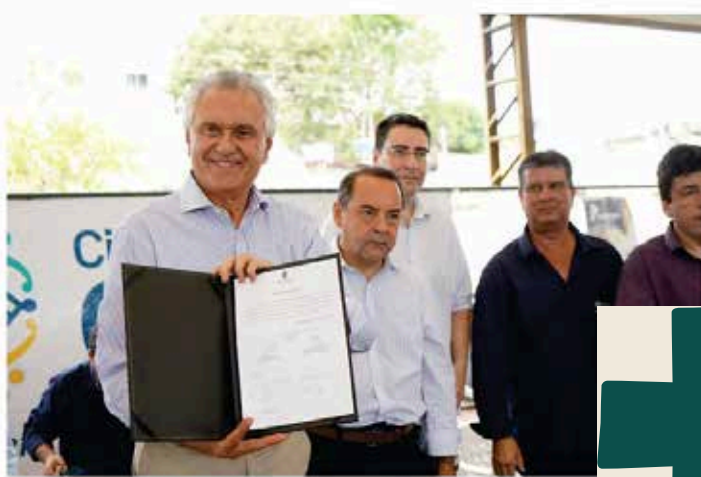
Equipamento, com capacidade de corte de até 10 mil peças por dia, é quinto entregue para atender micro e pequenos empresários, cooperativas e associações