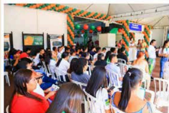
Feirão de Empregos do Cotec oferece centenas de vagas e realiza inscrições em cursos profissionalizantes.

O Governo de Goiás, por meio da Secretaria da Retomada, realiza nesta quinta-feira (17/11) e sexta-feira (18/11) a última edição do Feirão de Empregos do Colégio Tecnológico (Cotec) em 2022. O evento ocorre no Cotec Célio Domingos Mazzonetto, no município de Ceres, no Centro goiano. Os serviços serão realizados das 8h às 18h, por ordem de chegada.