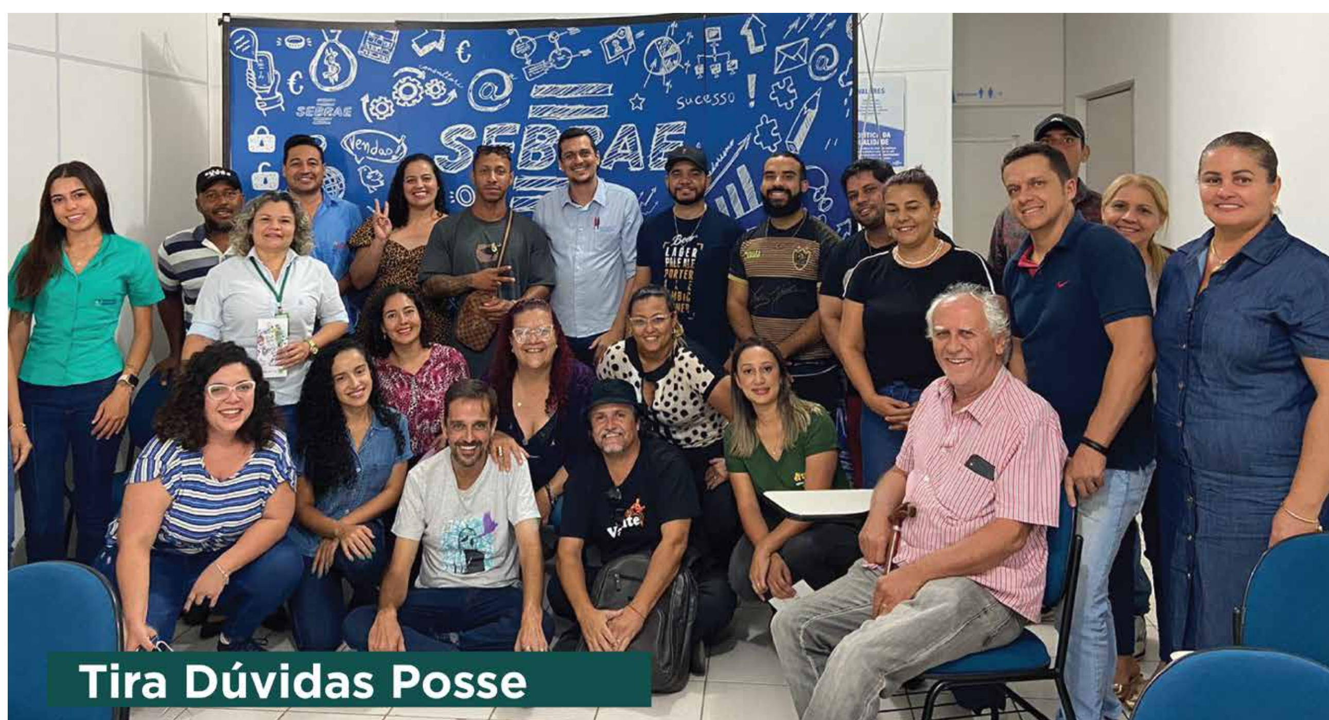
Tira Dúvidas Posse