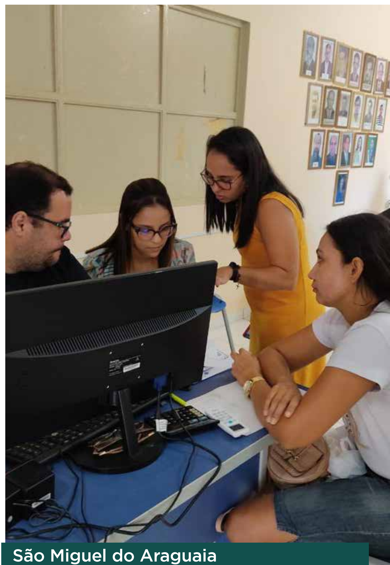
São Miguel do Araguaia

O trabalho busca alcançar os artistas goianos e teve início no domingo (6), em Luziânia. De terça a quinta (8 a 10/11), os destinos foram, São Miguel do Araguaia, Mozarlândia, Crixás e Novo Gama. Na quarta (9), os artistas de Posse, Rio Verde e Itumbiara também receberam a visita das equipes.