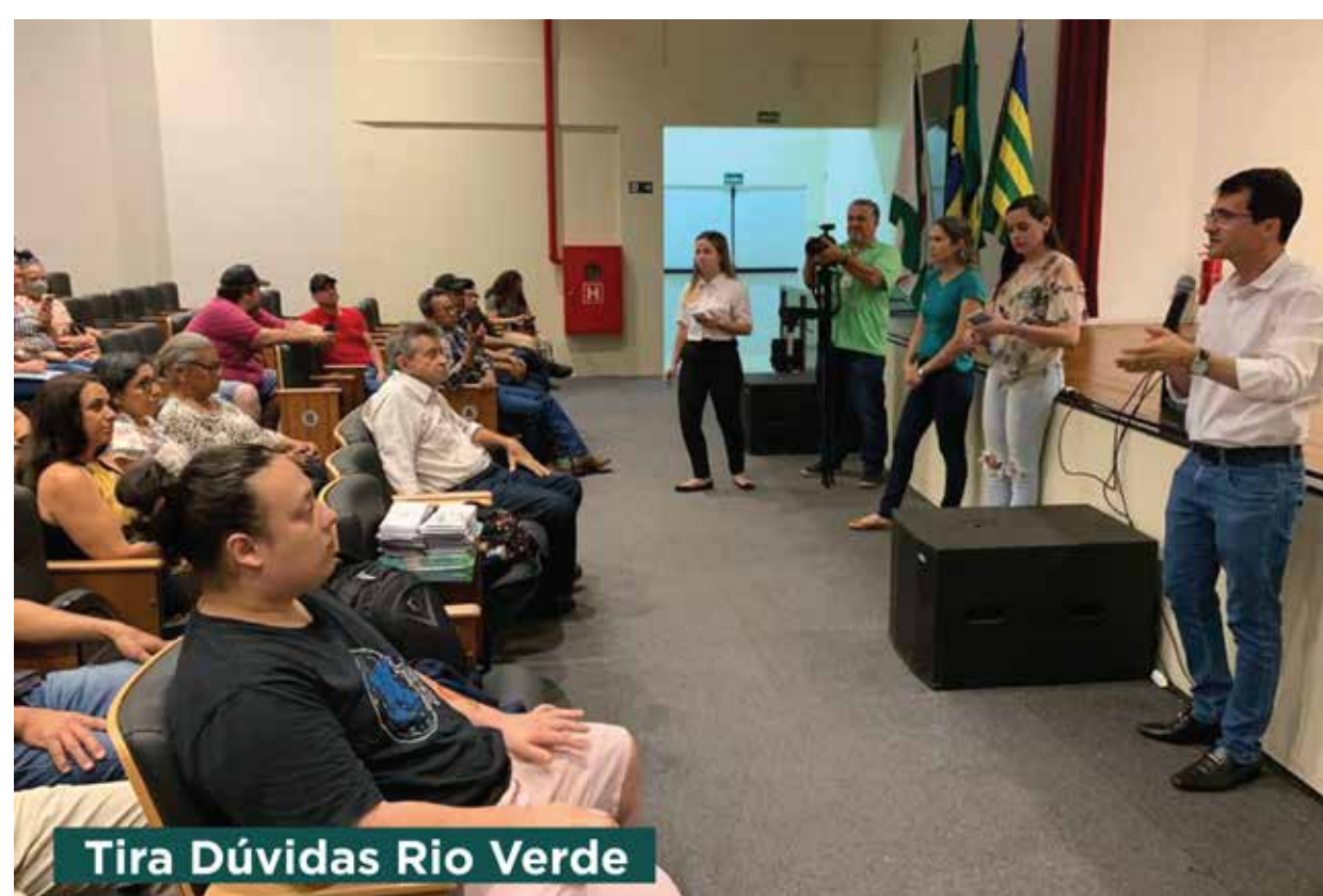
Tira Dúvidas Rio Verde