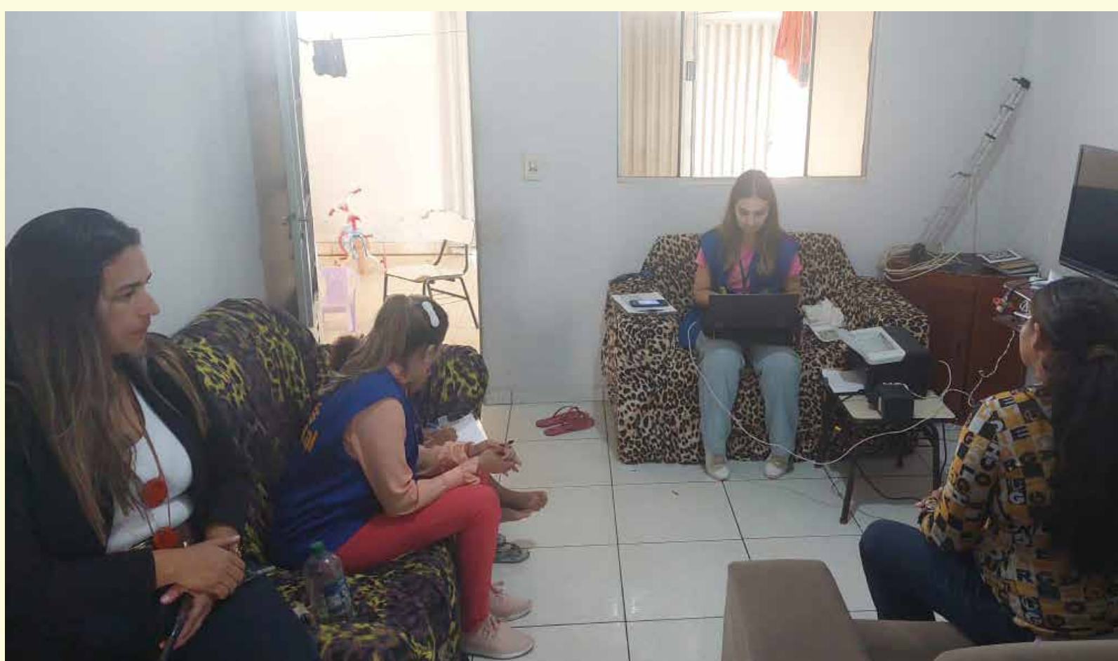
Abadia de Goiás