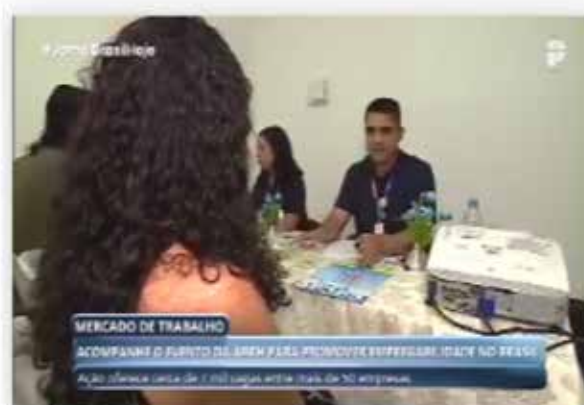
Evento gratuito oferece 7 mil vagas de emprego em Goiânia