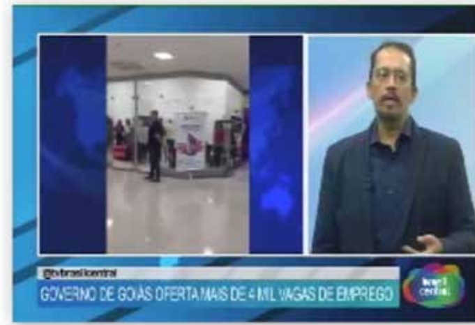
GOVERNO DE GOIÁS OFERTA MAIS DE 4 MIL VAGAS DE EMPREGO