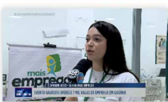
Evento gratuito oferece 7 mil vagas de emprego em Goiânia

Selecionando repertório para a gravação de seu novo projeto, o cantor e compositor "Armandinho" está na estrada com seu show. Na noite de sábado (23), ele se apresentará no Centro Cultural Oscar Niemeyer, em Goiânia. Suas músicas refletem as influências recebidas, trazendo uma mistura de pop com reggae, rock, surf rock e pitadas de romantismo.