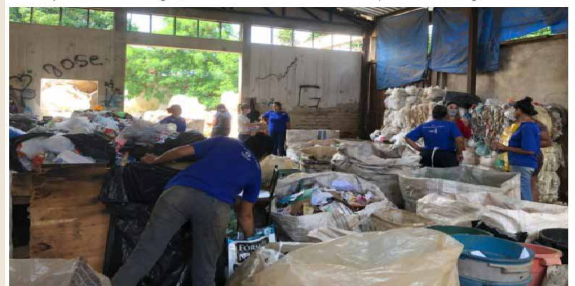
Painel promovido pela Secretaria da Retomada no Fica vai tratar do papel dos catadores na destinação correta dos resíduos.

Além das palestras sobre reciclagem, a secretaria também vai realizar cursos profissionalizantes gratuitos