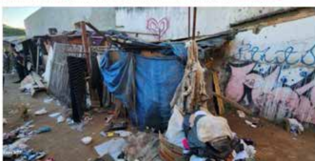
A separação de material reciclável foram resgatadas de condições de trabalho análogas à escravidão ontem (21/06), no Bairro Jardim América, em uma grávida cuja gestação estava no sexto mês. A operação foi realizada em conjunto pelos seguintes órgãos: Ministério Público do Trabalho em Goiás (MPGT), Defensoria Pública da União (DPU), Polícia Federal (PF), Secretaria de Trabalho e Desenvolvimento Social (SEDES) e Secretaria Estadual de