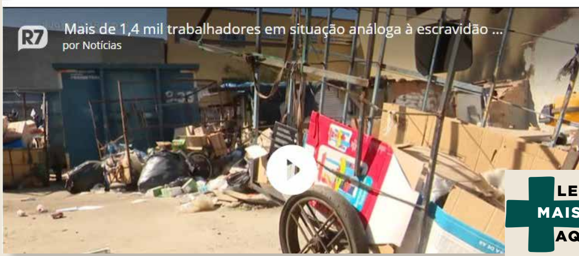
Mais de 1,4 mil trabalhadores em situação análoga à escravidão ... por Notícias

Caso mais recente foi em Goiânia (GO); 10 pessoas foram resgatadas