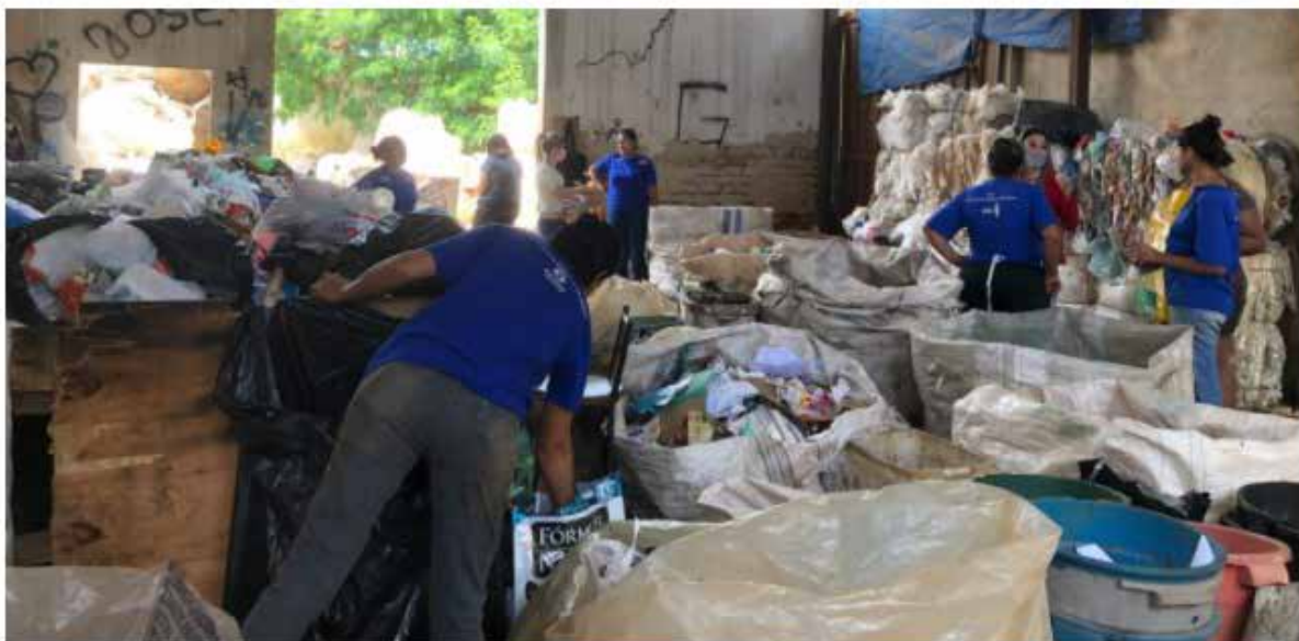
Painel de palestras promovido pela secretaria tem por objetivo promover a discussão sobre a relação entre o ser humano e a natureza.

Painel de palestras promovido pela secretaria tem por objetivo promover a discussão sobre a relação entre o ser humano e a natureza