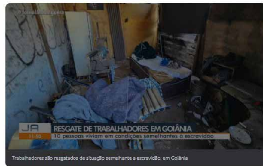
Trabalhadores são resgatados de situação semelhante a escravidão, em Goiânia

Segundo os auditores do trabalho, local funcionava há 4 anos. O estudo feito pelos auditores apontaram que ao menos 20 catadores de reciclagem utilizavam o espaço.