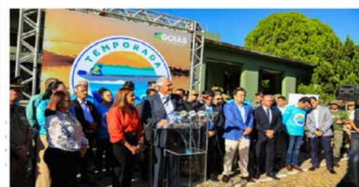
Ronaldo Caiado no lançamento da temporada do Araguaia de 2023: "nossa preocupação é reagitar aquilo que é mais emblemático, que é a beleza, o entardecer e as praias do Araguaia".

Governo de Goiás destina R$ 14 milhões em estrutura para qualificar atendimento ao turismo na região