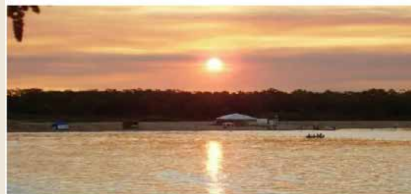
Temporada Araguaia.

Governo de Goiás anunciou reforço na segurança com aumento no efetivo dos bombeiros e polícia.