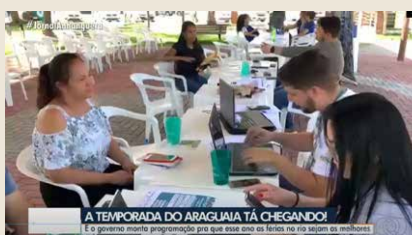
A TEMPORADA DO ARAGUAIA TÁ CHEGANDO! É o governo montou programação pra que esse ano as férias no rio sejam as melhores

A temporada mais aguardada do ano pelos goianos se aproxima e mais de 1 milhão de turistas devem aproveitar as tradicionais praias do Rio Araguaia em 2023. Com investimento de mais de R$ 14 milhões, a temporada Mais Araguaia, organizada pelo Governo de Goiás, conta com ações em seis municípios e dois distritos da região, que incluem reforço na fiscalização ambiental, aumento do efetivo do Corpo de Bombeiros e das forças policiais, incentivo ao turismo consciente e qualificação profissional dos trabalhadores.