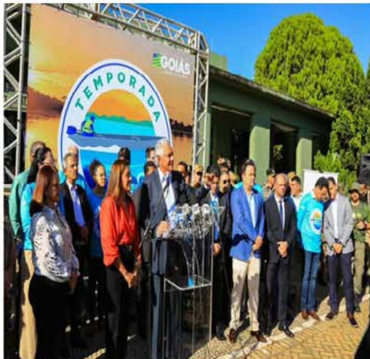
Ronaldo Caiado no lançamento da temporada do Araguaia de 2023: "nossa preocupação é reagitar aquilo que é mais emblemático, que é a beleza, o entardecer e as praias do Araguaia".

Em 2023, previsão é receber 1 milhão de turistas. Governo de Goiás destina R$ 14 milhões em estrutura para qualificar atendimento ao turismo na região, com melhorias em segurança, conscientização ambiental e geração de emprego