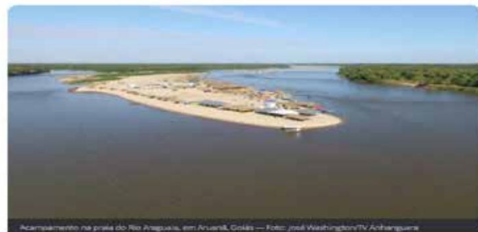
Acomodamento na praia do Rio Araguaia, em Aruanã, Goiás.

Governo faz ações em seis municípios e dois distritos para reforçar a segurança, incentivar o turismo e preservar o meio ambiente. Expectativa para a temporada é de que mais de R$ 100 milhões sejam injetados na economia com a ida dos turistas.