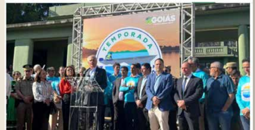
Lançamento da temporada mais aguardada no Palácio das Esmeraldas nesta segunda-feira (29)

Entre as ações, inclui o reforço na segurança, incentivo ao turismo, qualificação a trabalhadores e educação ambiental. Expectativa para a temporada é de que mais de R$ 100 milhões sejam injetados na economia com a ida dos turistas