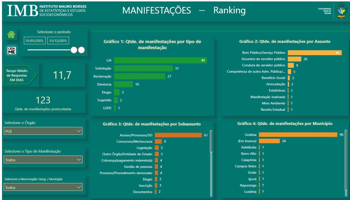
Gráfico 1 - Manifestações gerais recebidas pela Ouvidoria.

• Das manifestações recebidas pela Ouvidoria ao longo do ano de 2025, observa-se que a Lei de Acesso à Informação (LAI) foi o tema predominante, com 49 manifestações. Esse dado ressalta a importância da transparência e do acesso às informações públicas para os cidadãos.