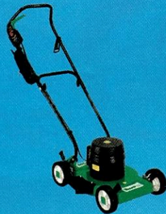
283427 Cortador de Grama SL-350 1800W TRAPP

10x R$ 164,90 à vista / a prazo R$ 1.649,00