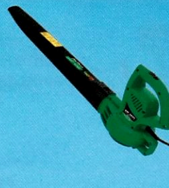
360606 Soprador de Folhas GSF-2000 GARTHEN

10x R$ 249,90 à vista / a prazo R$ 2.499,00