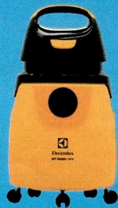
110300 Aspirador de Pó e Água GT30N ELECTROLUX

10x R$ 39,90 à vista / a prazo R$ 399,00