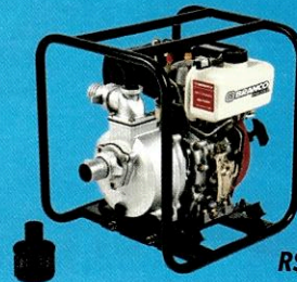
90304200 Motobomba BD-710CF 2" BRANCO

10x R$ 489,90 à vista / a prazo R$ 4.899,00