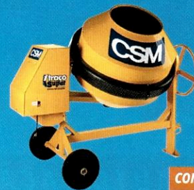
40104201 Betoneira 1 Traço Super 400L CSM

10x R$ 76,90 à vista / a prazo R$ 769,00