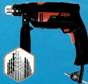
F0126555JK Furadeira 13Mm 570W + 14 Brocas 6555 SKIL

10x R$ 39,90 à vista / a prazo R$ 399,00