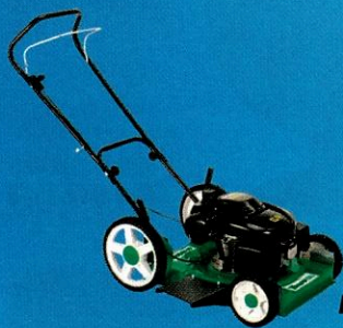
2931353 Cortador de Grama LF-600RM 6,5hp 4T TRAPP

10x R$ 23,90 à vista / a prazo R$ 239,00