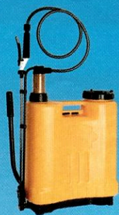
34380 Pulverizador Costal Simétrico 20L GUARANY

10x R$ 229,90 à vista / a prazo R$ 2.299,00