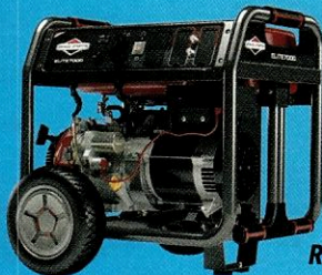
030624 Grupo Gerador BS G 7000 Elite partida elétrica BRANCO

10x R$ 19,90 à vista / a prazo R$ 199,00