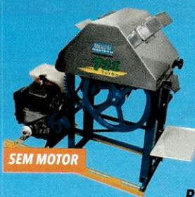
287104 Engenho de Cana B-721 rolo inox VENCEDORA

10x R$ 34,90 à vista / a prazo R$ 349,00