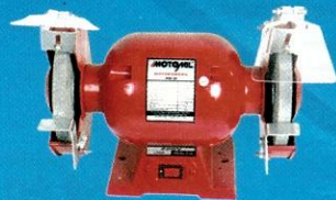
75892 Motoesmeril MM150 Hobby 360W MOTOMIL

10x R$ 329,90 à vista / a prazo COM MOTOR 9,00