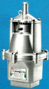
83690 Bomba Submersa 800 220V/60HZ ANAUGER

10x R$ 39,90 à vista / a prazo R$ 399,00