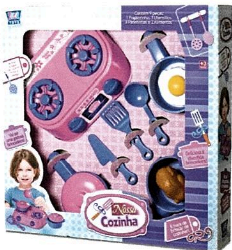
Ref 7663 – Nossa Cozinha