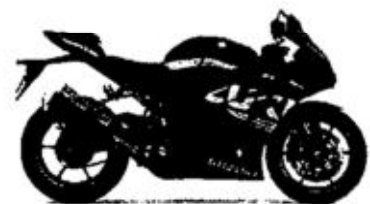
*GSX-R1000A *GSX-R1000RA *GSX-R1000RAZ