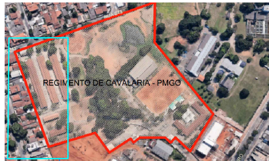
LOCALIZAÇÃO DO MURO

INFORMAÇÃO: Área de muro a ser rebocada - 212,48 M 2