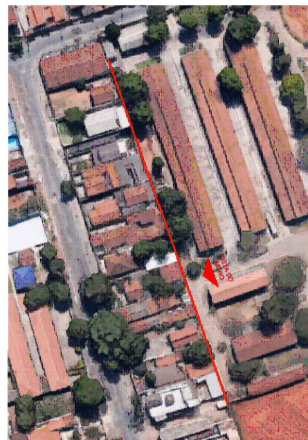
MURO A SER REFORMADO