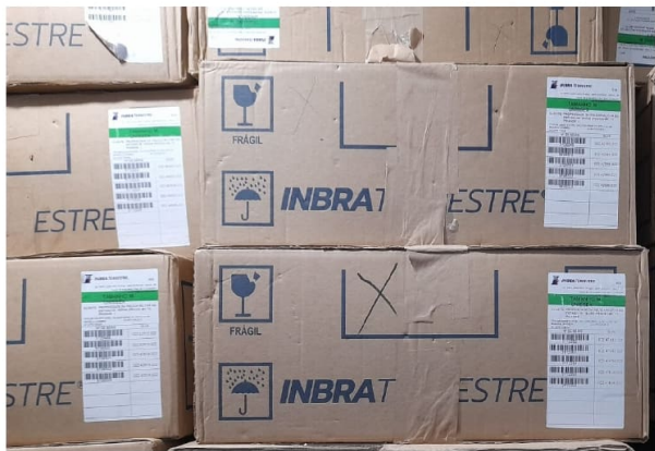
Fotos dos Coletes de Proteção Balística adquiridos pela PMGO com o recurso do Tesouro Estadual no ano de 2023.

No mês de novembro e dezembro foi paga a aquisição de armamento para a PMGO, mais específico para duas unidades: o BPM Rural e o 08ª CIPM do 09º CRPM. Foram adquirindo arma de fogo portátil, espécie carabina, semiautomática de série, sem customização, no Calibre 5,56x45mm NATO com conversão para outro calibre, multicalibre, com sistema próprio (upper receiver) e troca de cano, mira mecânica flip-up, com carregadores, bandoleiras para cada armamento e peças de reposição.