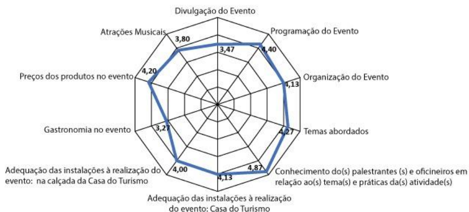
Gráfico 1: Avaliação do evento.