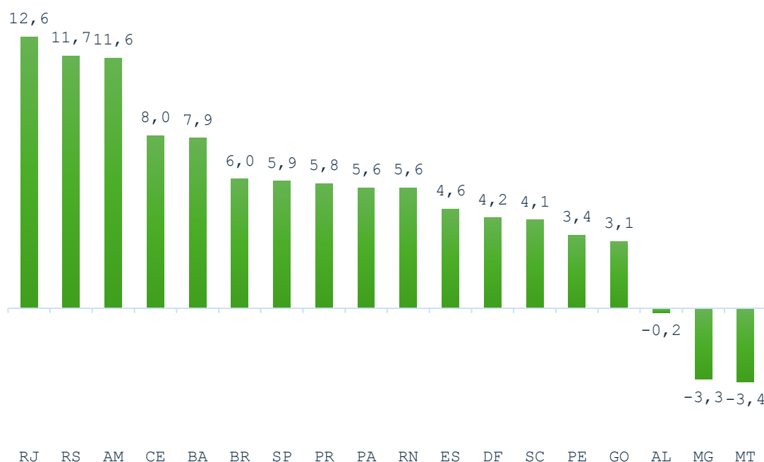
Gráfico 01: Pesquisa Mensal de Serviços - (Volume de Atividades Turísticas) Variação Acumulada no Ano - Agosto/2025 (Base: igual período do ano anterior) (%)