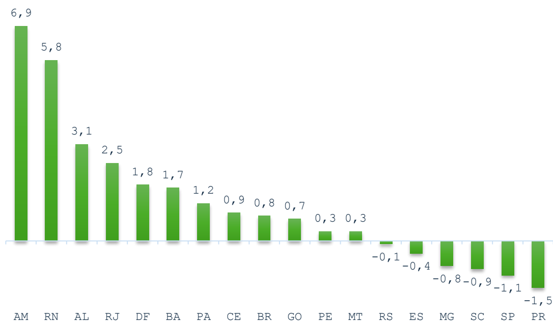
Gráfico 04: Pesquisa Mensal de Serviços- (Volume de Atividades Turísticas) Variação Mês / Mês anterior – Agosto/2025 (Série com Ajuste Sazonal) (%)