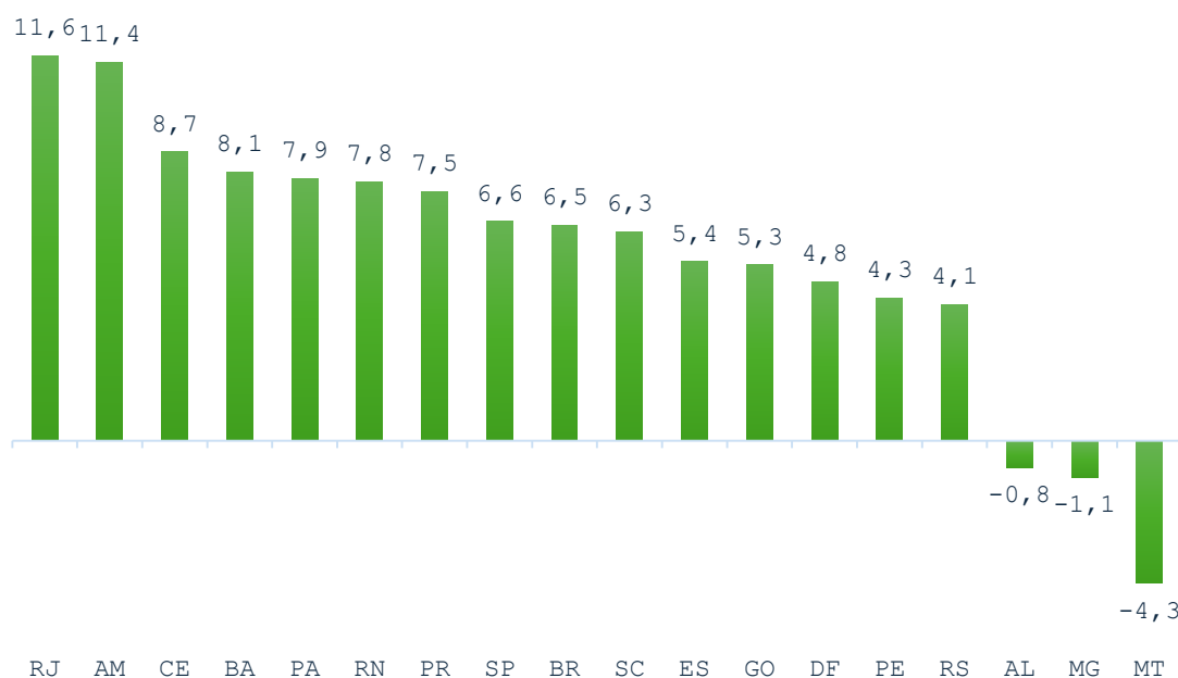
Gráfico 02: Pesquisa Mensal de Serviços - Resultados Regionais (Volume de Atividades Turísticas) Variação últimos 12 meses (%)