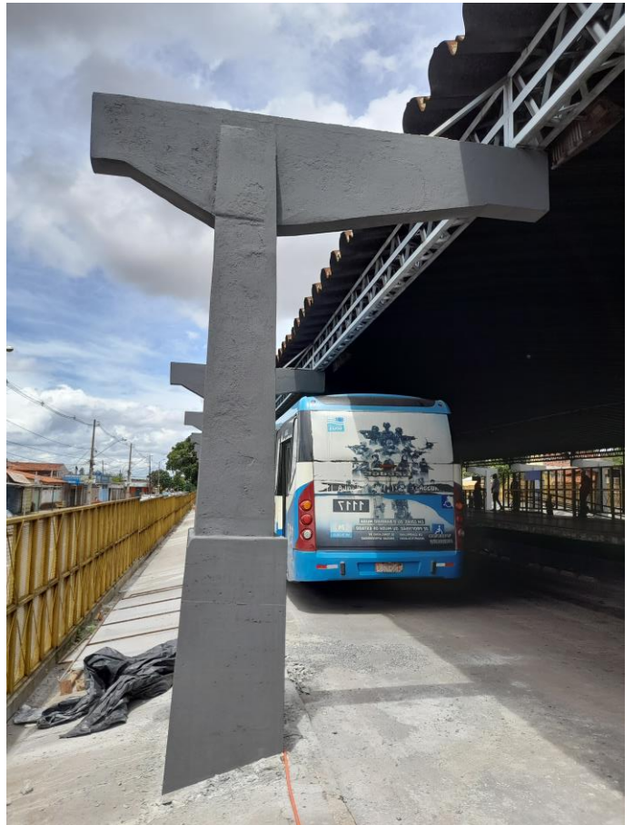
Vista antes e depois de pilar e viga após execução de recuperação e reforço estrutural.