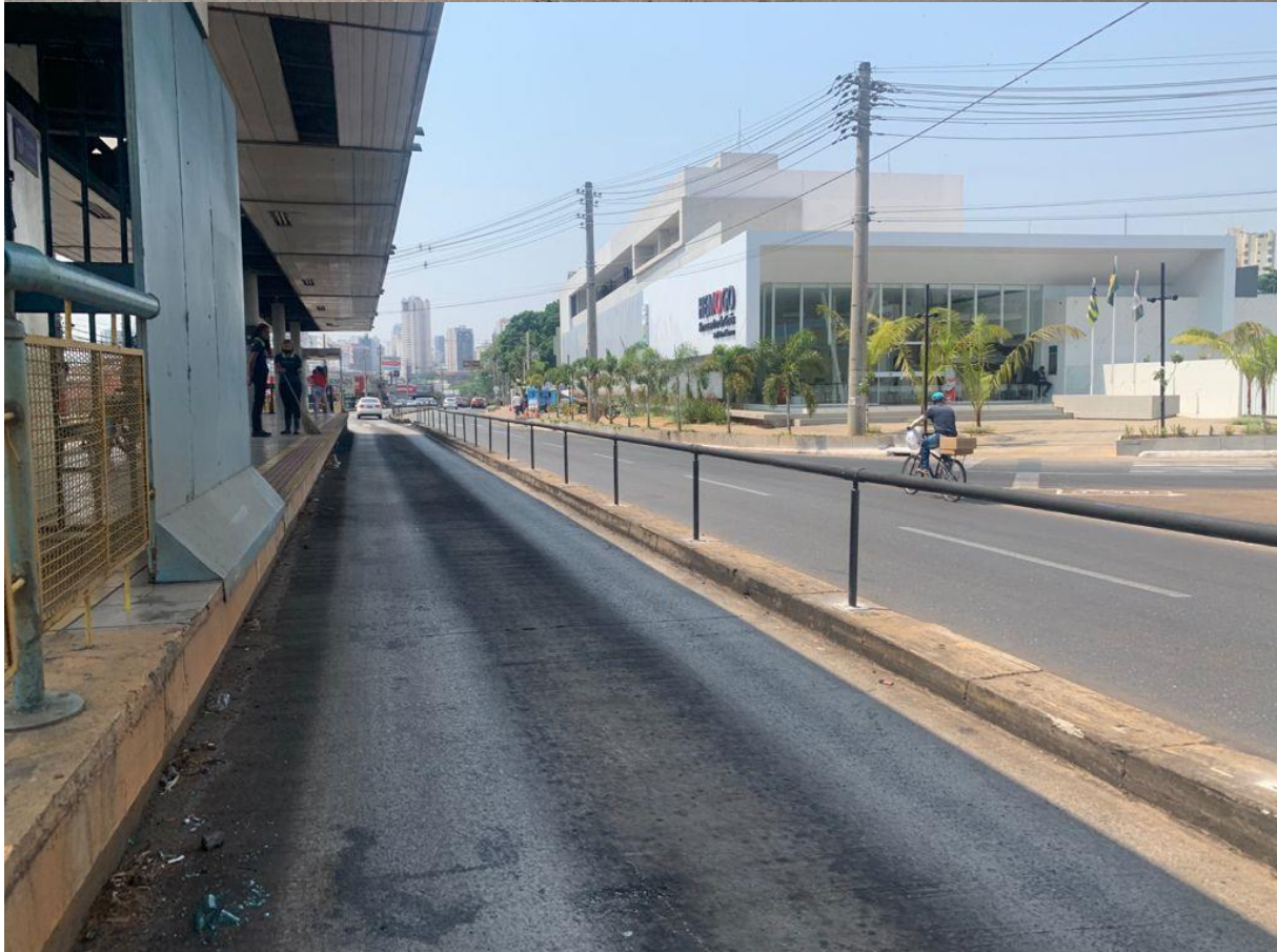
Vista antes e depois de execução de instalação de gradil no Eixo Anhanguera.