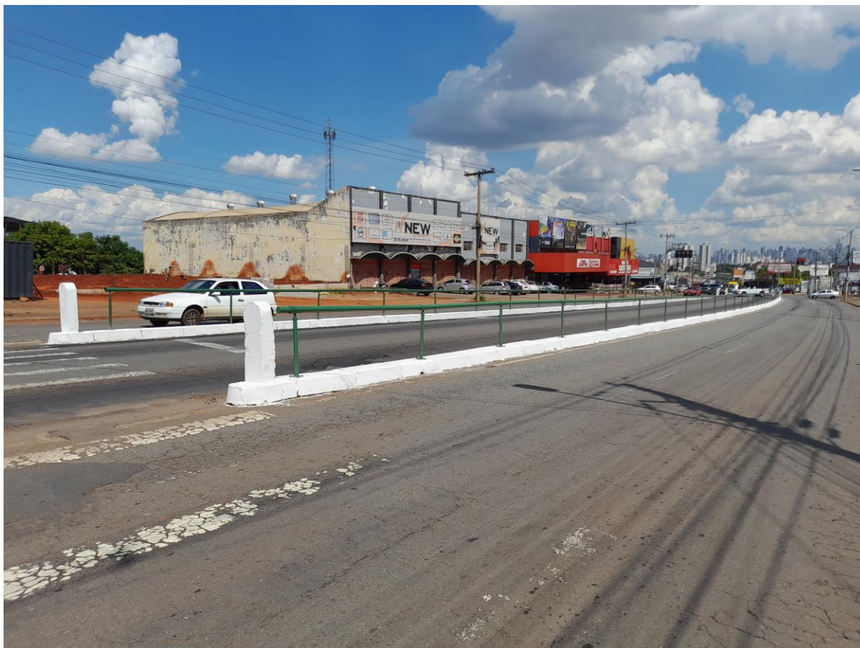
Amostra geral de gradil instalado e pintado, bem como artefatos de concreto e guias instaladas e pintadas.