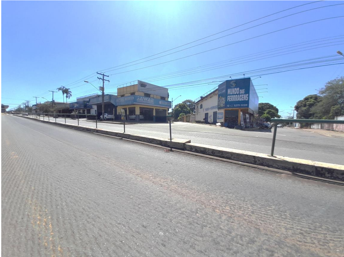
Vista de ponto do Eixo Anhanguera com Gradil danificado