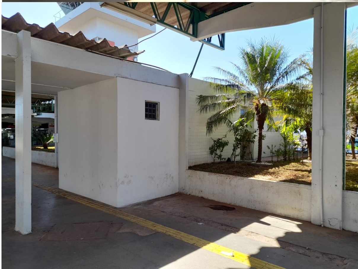
Vista antes e depois de construção de banheiro PCD no Terminal Padre Pelágio