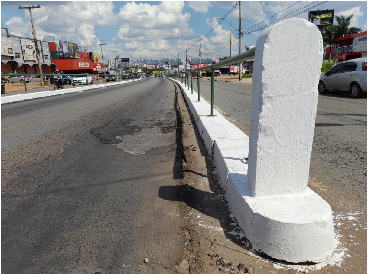
Amostra de artefato de concreto instalado e guias do eixo pintadas.