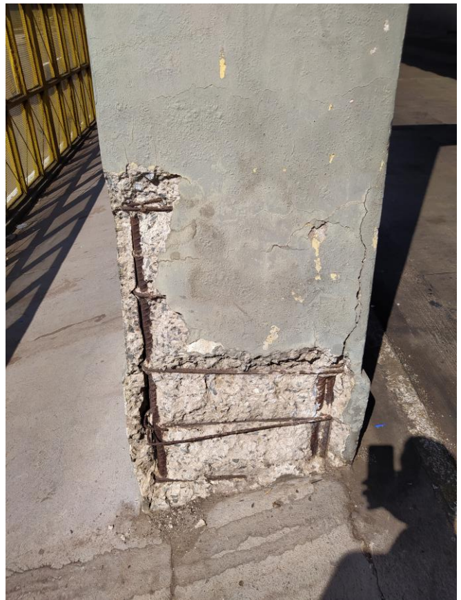
Amostra de um pilar com estrutura comprometida