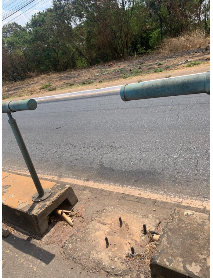
Amostra de artefato de concreto danificado e guia de concreto em falta.