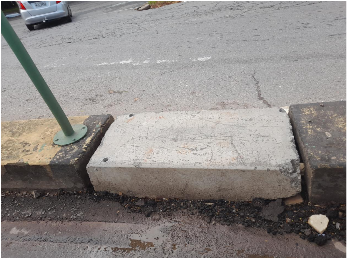
Amostra de guia de concreto instalada.