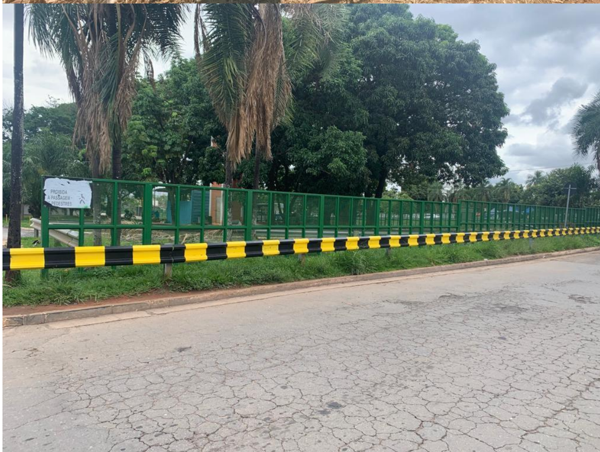
Vista antes e depois de execução de pintura de segurança no guard-rail de proteção do Terminal Padre Pelágio