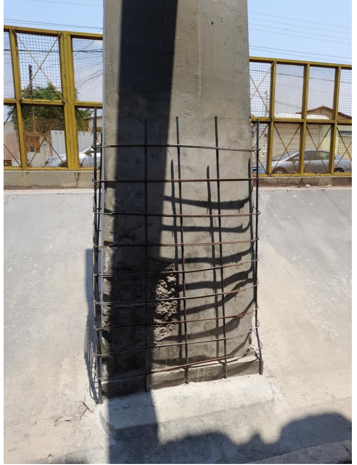
Amostra de pilar em execução de recuperação e reforço estrutural