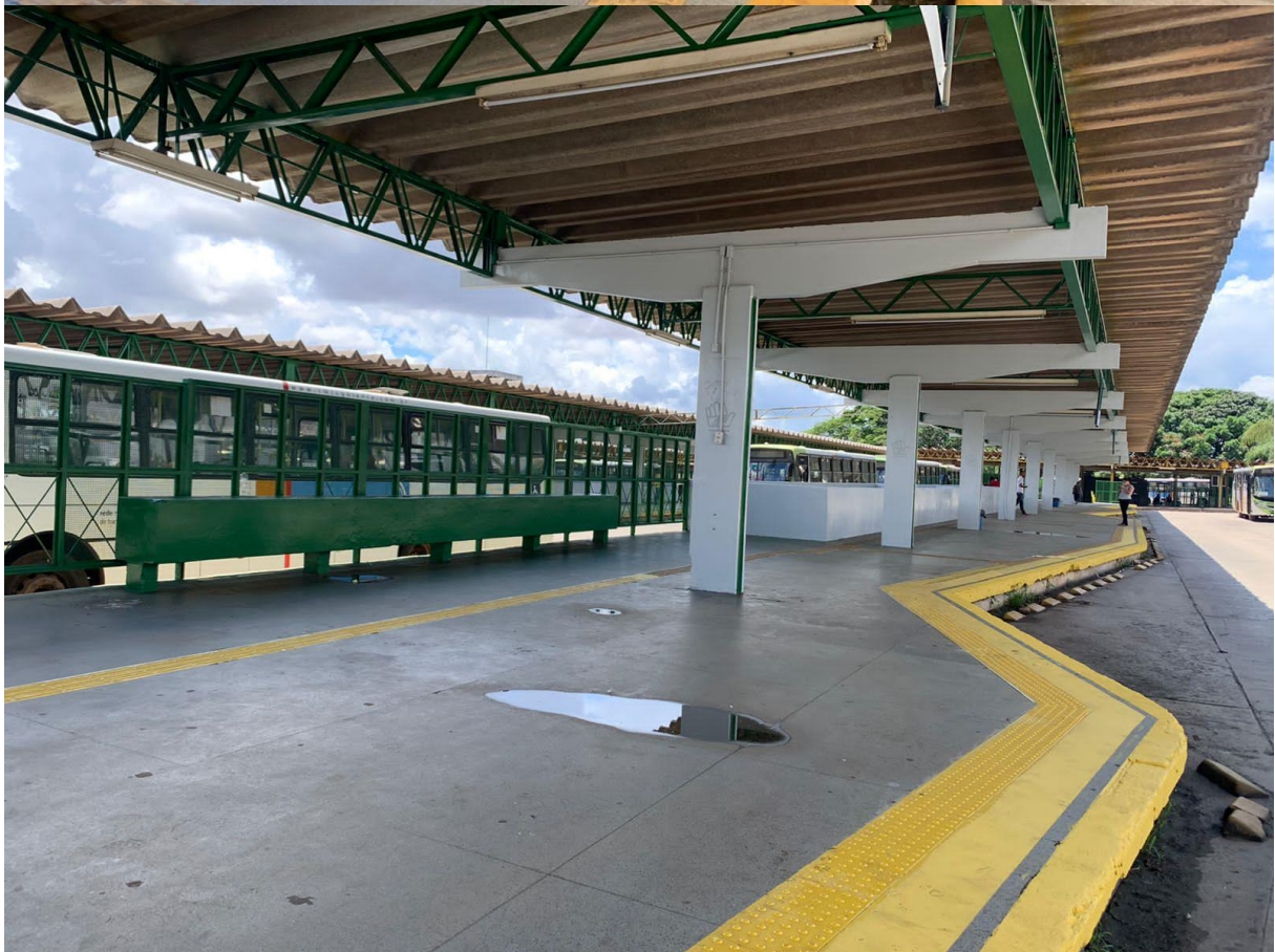
Vista antes e depois de execução de pintura geral e pintura de segurança com demarcação de piso tátil