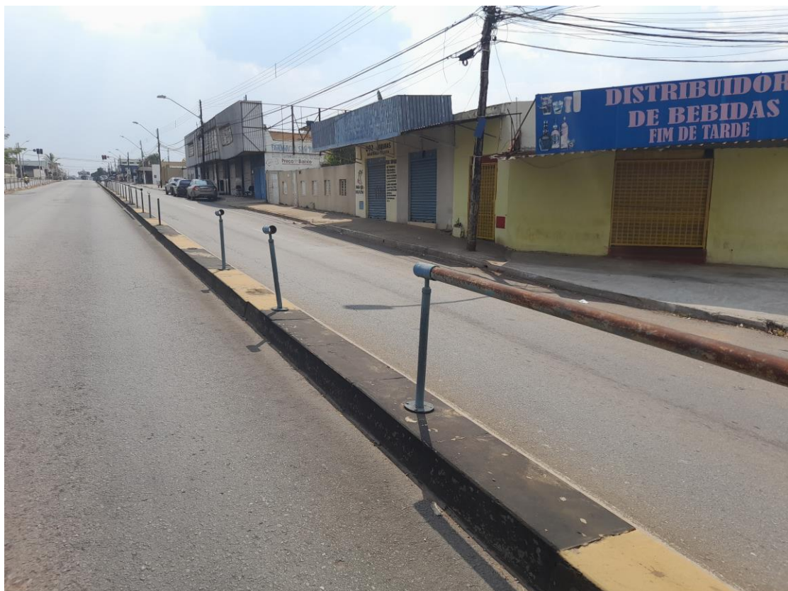
Vista de ponto do Eixo Anhanguera com Gradil danificado