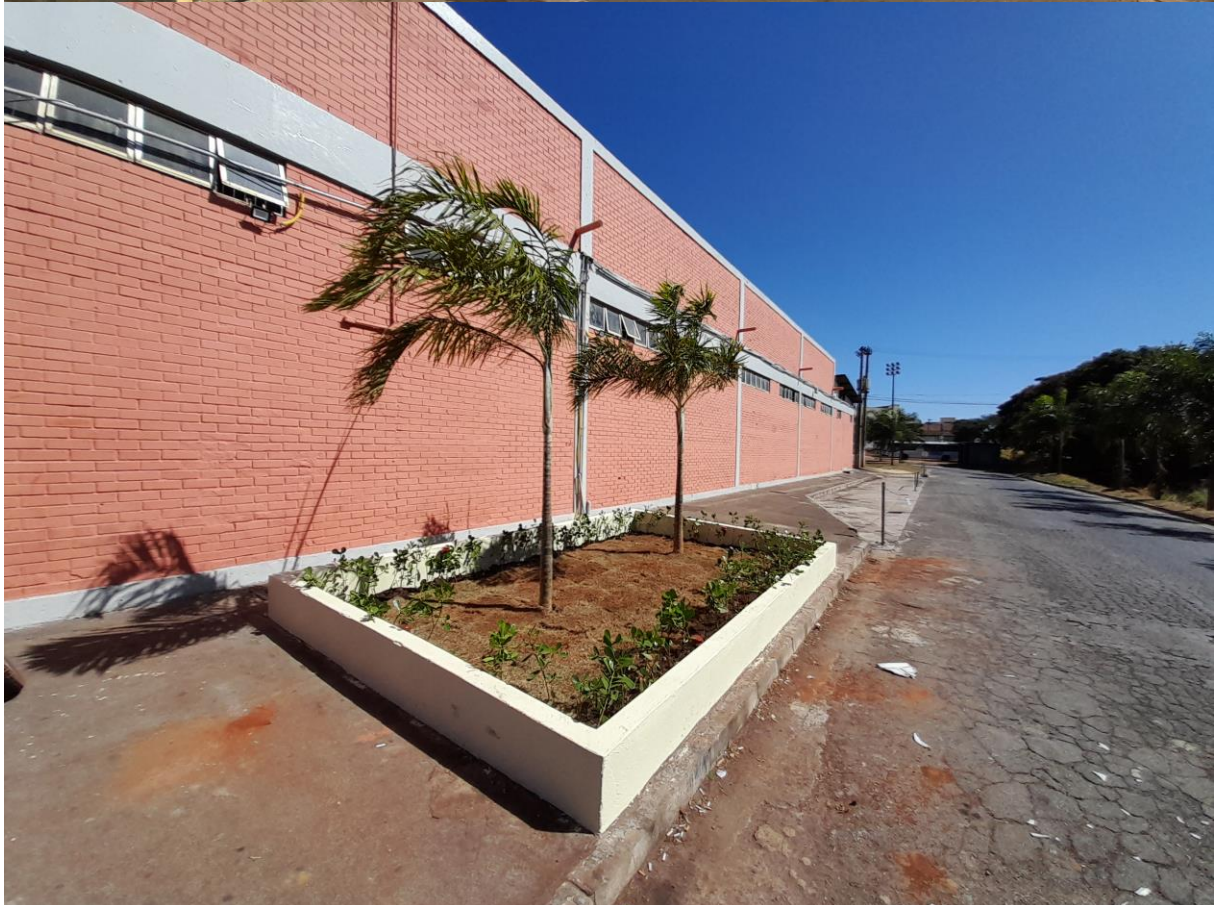
Vista antes e depois de execução de pintura geral e implantação de paisagismo