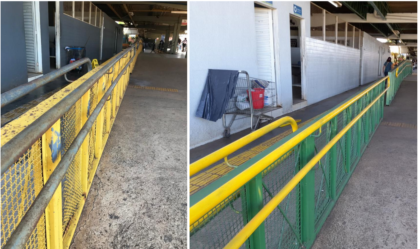
Vista antes e depois de execução de pintura de corrimão e guarda corpo.