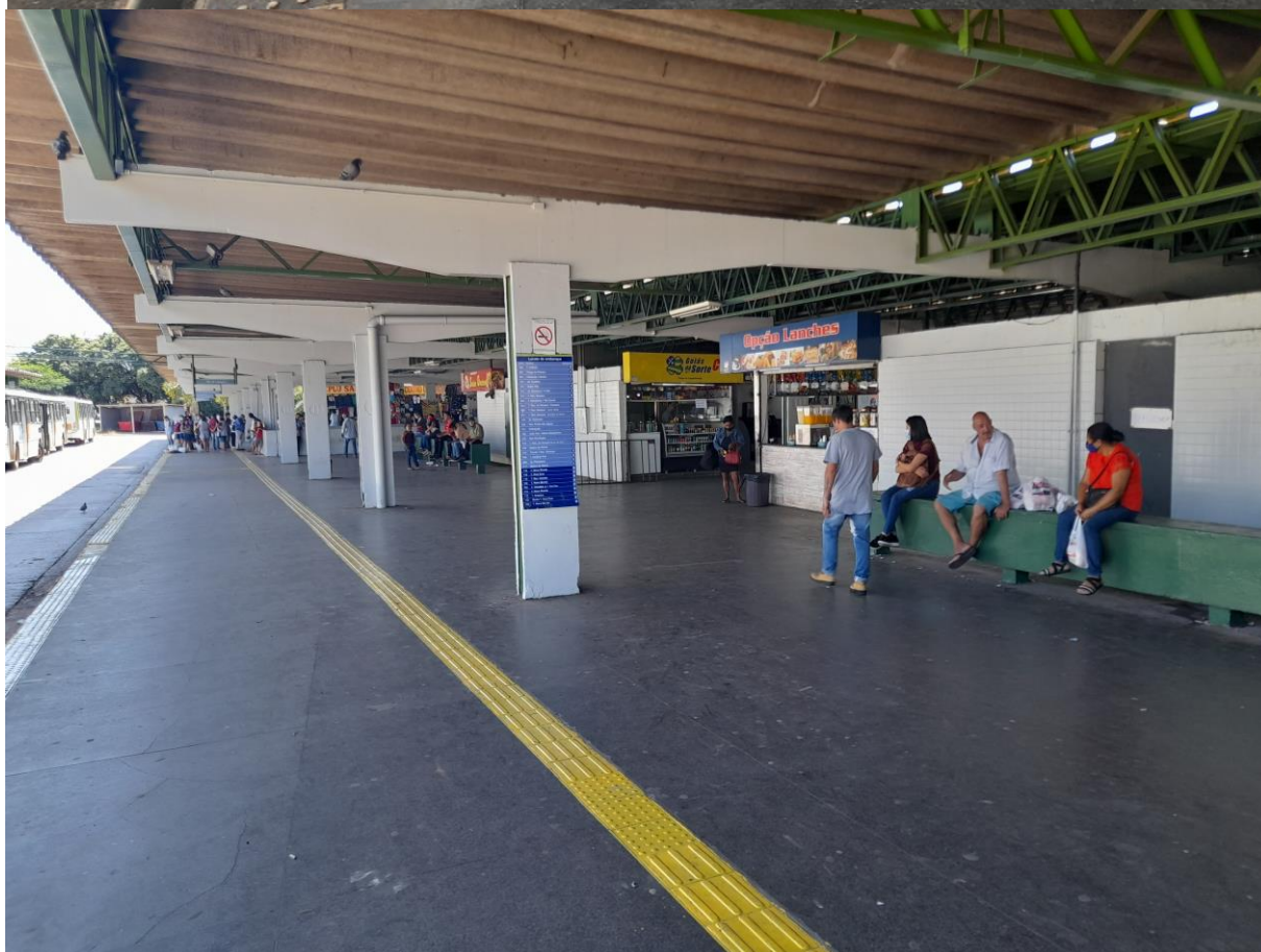
Vista antes e depois de execução de pintura geral e pintura de segurança com demarcação de piso tátil