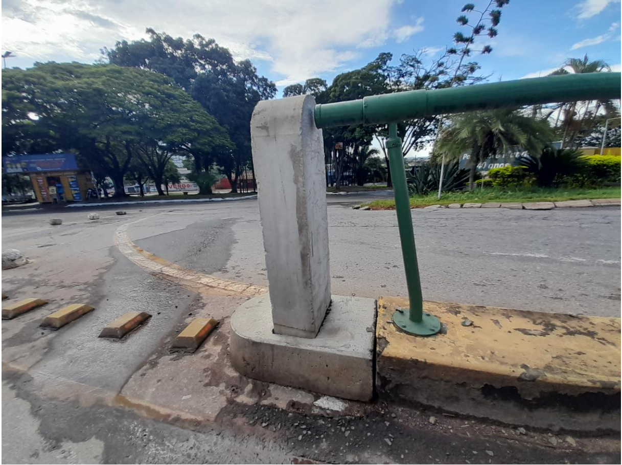
Amostra de artefato de concreto instalado.