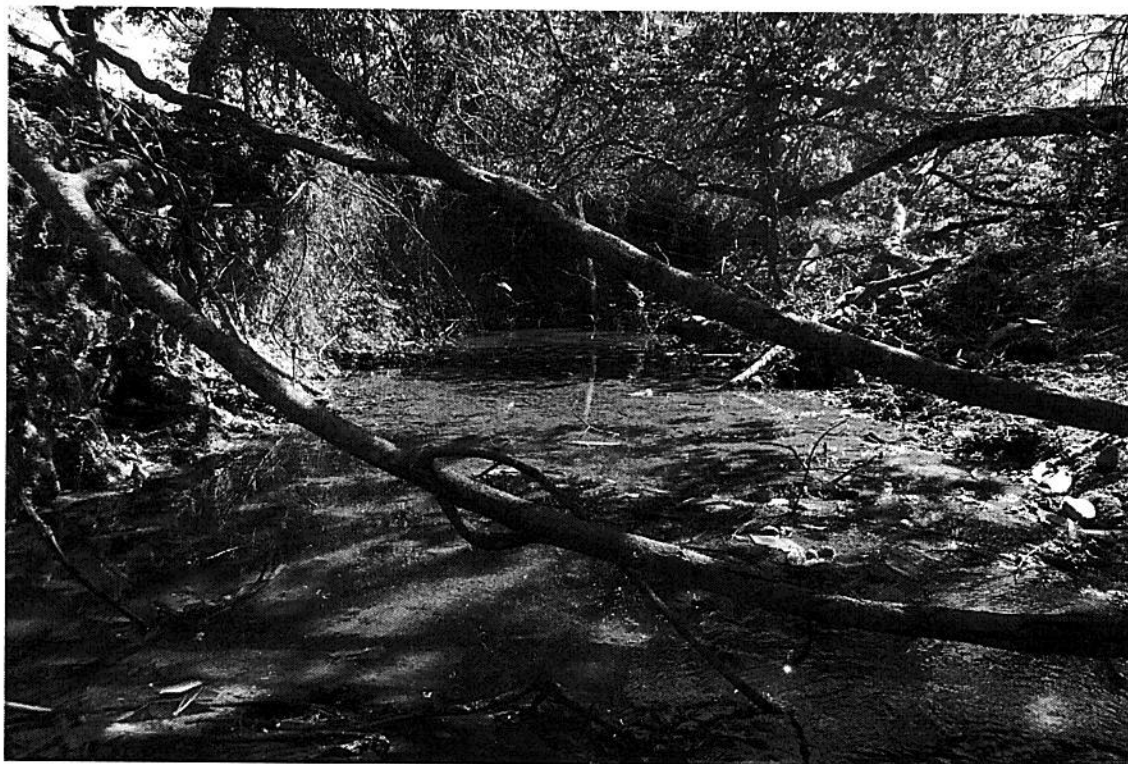
Foto11 e 12. Curso hídrico no limite leste do imóvel (córrego cabeceiras do rio dos Bois).