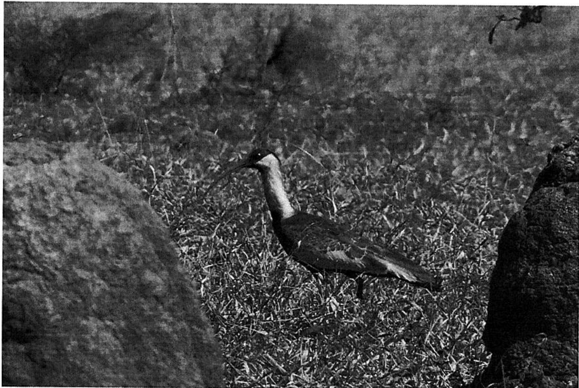
Foto 4 e 5. Limite norte da RPPN Santo Inácio, mostrando a conectividade com outros fragmentos de vegetação nativa e Curicaca.