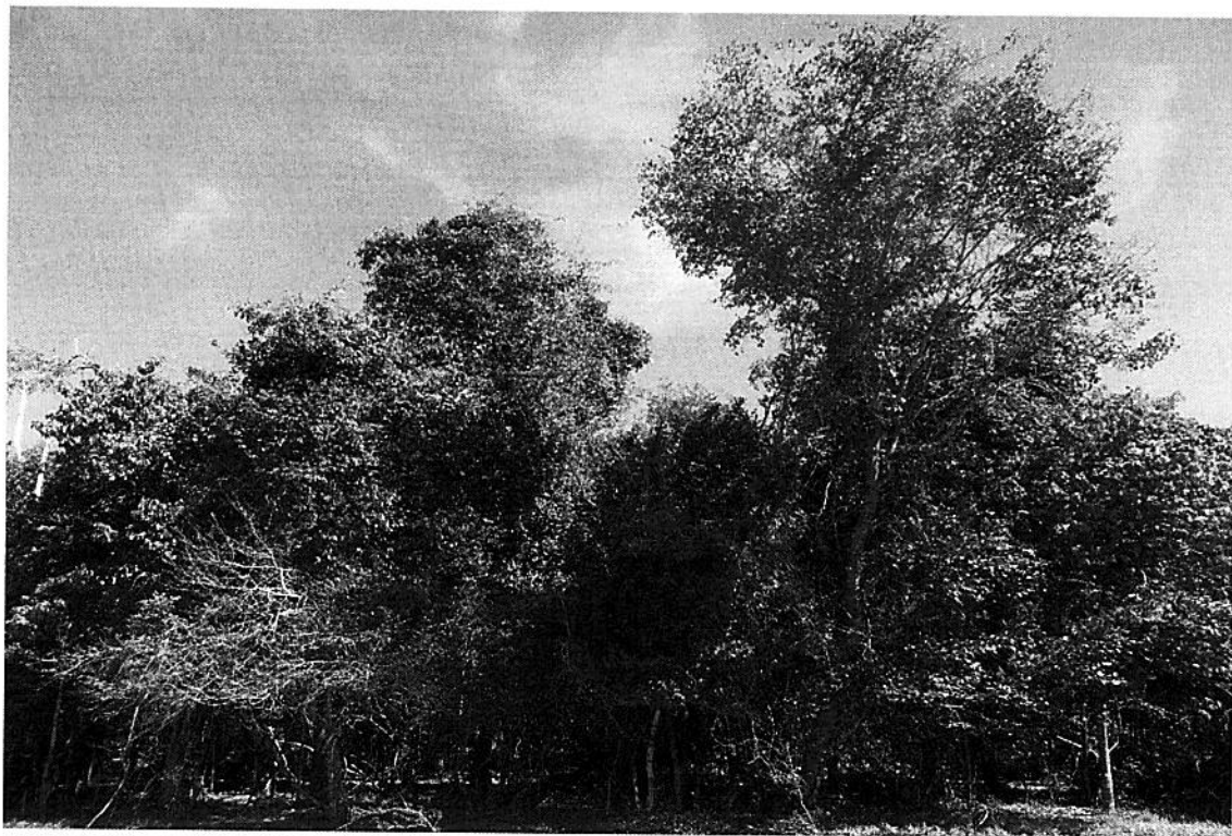
Foto 15 e 16. Vista geral da vegetação da RPPN Santo Inácio.