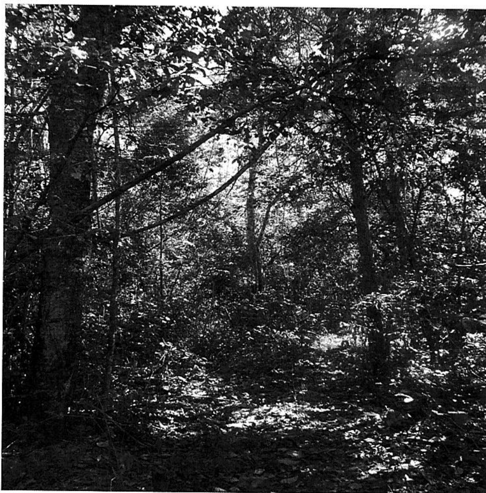
Foto 1. Vegetação no interior da RPPN Santo Inácio.