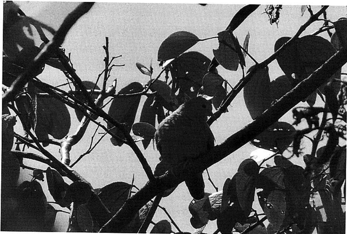
Foto 7 e 8. Toca de tatu e rolinha-roxa.