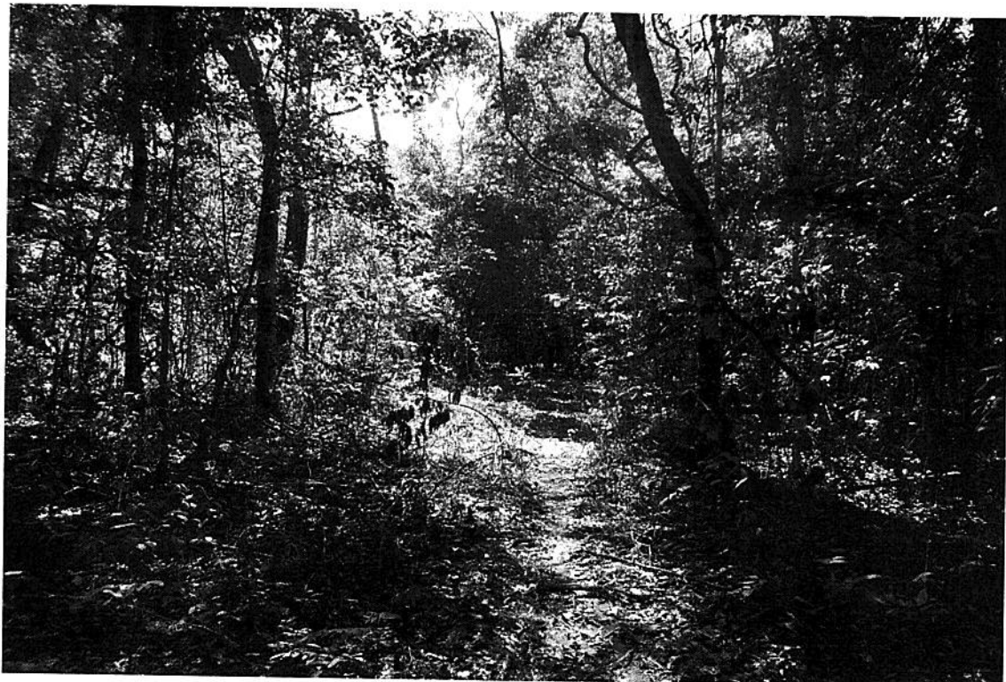
Foto 2 e 3. Trilhas no interior da RPPN Santo Inácio.