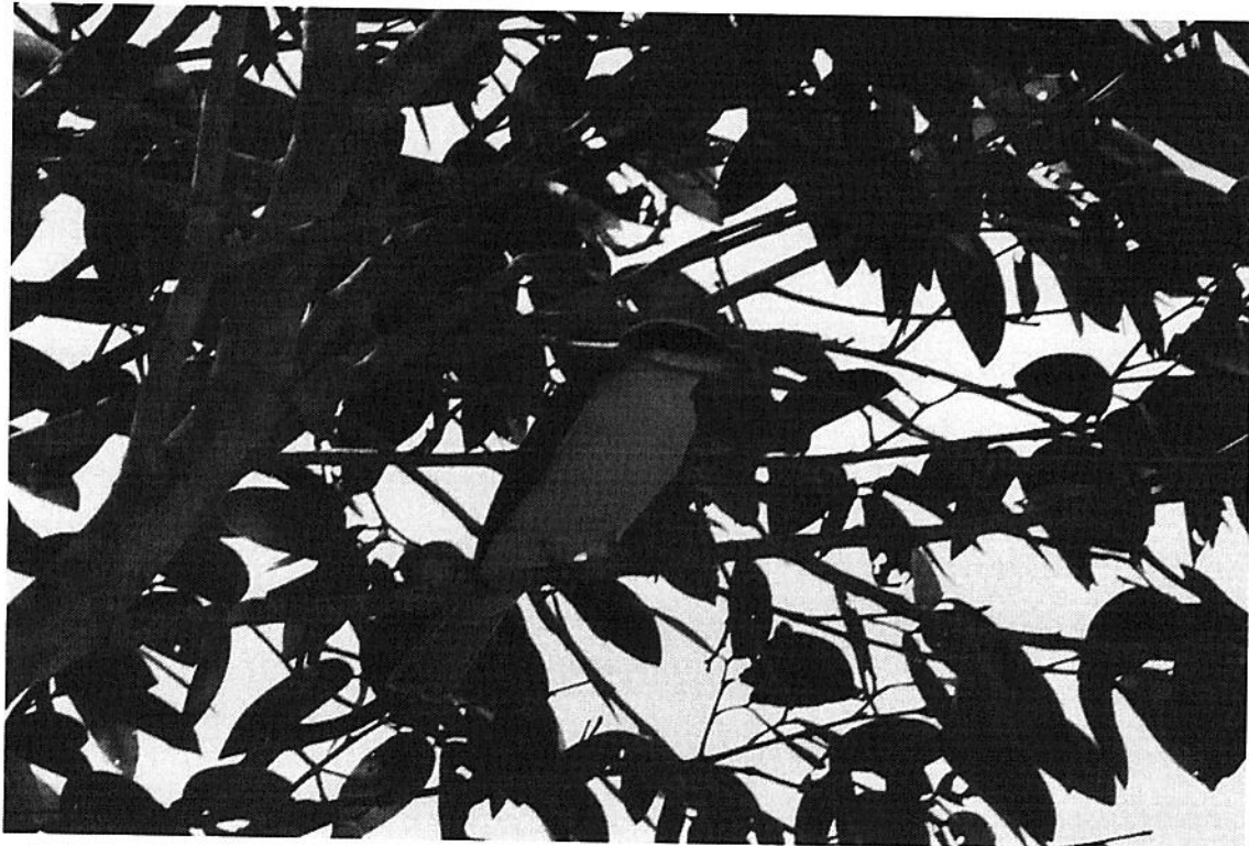
Foto 5 e 6. Guaracava-de-topete-uniforme e bem-te-vi.