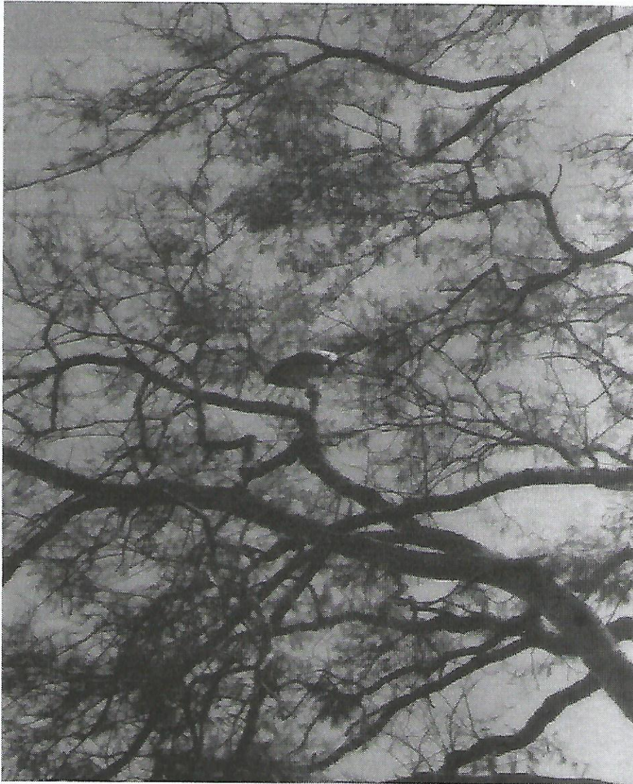
Figura 1. Urubu-rei avistado na área da RPPN.