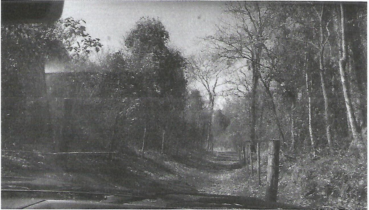
Figura 2. Aspecto geral da área de floresta semidecídua, observado a partir da estrada interna.

SECRETARIA DE ESTADO DE MEIO AMBIENTE, RECURSOS HÍDRICOS, INFRAESTRUTURA, CIDADES E ASSUNTOS METROPOLITANOS SECIMA