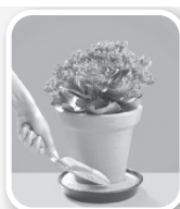
Coloque areia no pratinho dos vasos de plantas