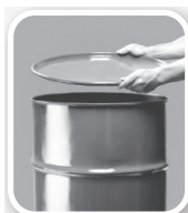
Feche bem tonéis e barris

Defenda sua família, seus vizinhos, sua comunidade. Não basta combater o mosquito. Precisamos eliminar seus criadouros e qualquer local ou recipiente que acumule água parada.