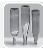
Esvazie e guarde garrafas sem uso de cabeça para baixo