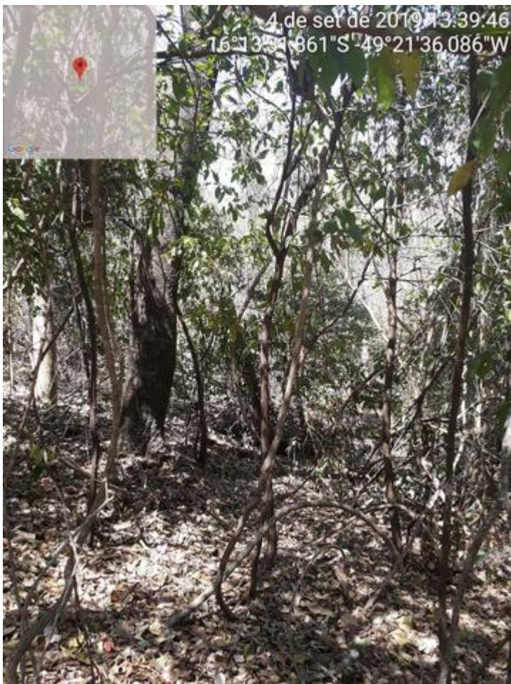
Foto 4 e 5. Vegetação no interior da RPPN Capoeirão.