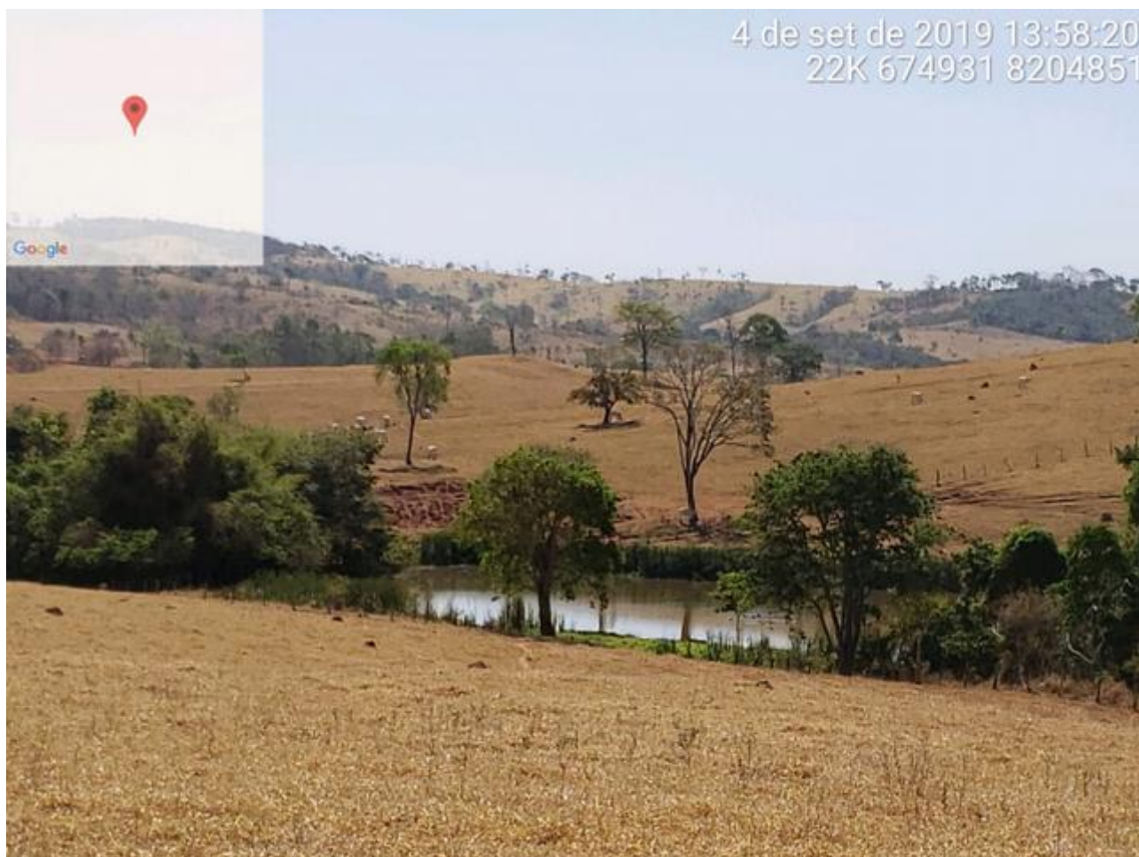
Foto 6: Córrego Capoeirão, manancial de abastecimento do município nos limites do imóvel do proprietário