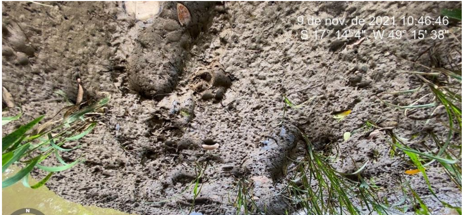
Foto 4: Pisoteio de gado dentro da RPPN, área não é cercada, provavelmente para descendação dos animais