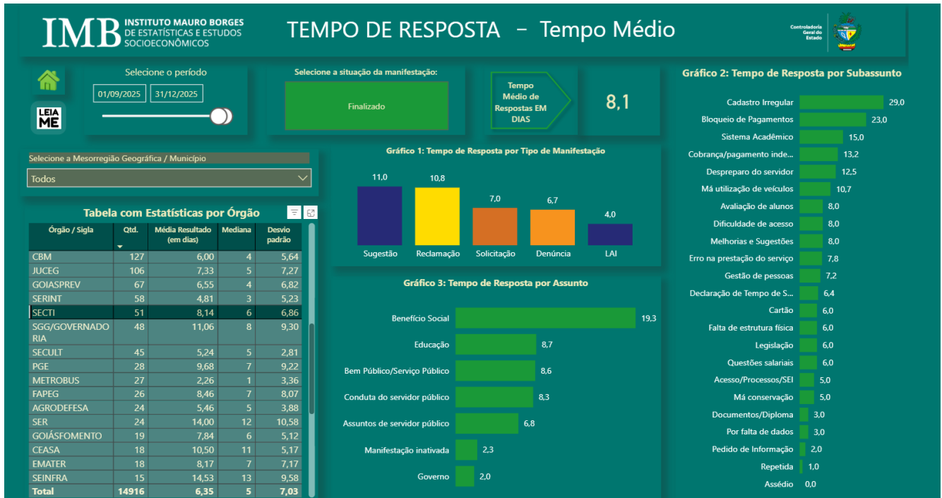
Figura 2: Tempo Médio de Resposta/SECTI