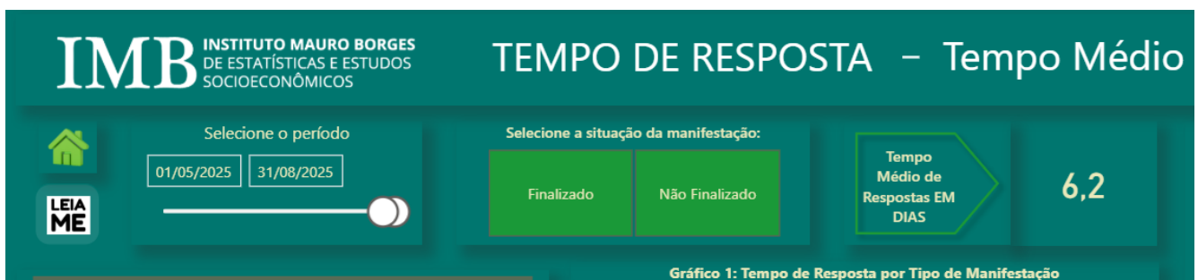
Figura 3: Tempo Médio de Resposta/Estado