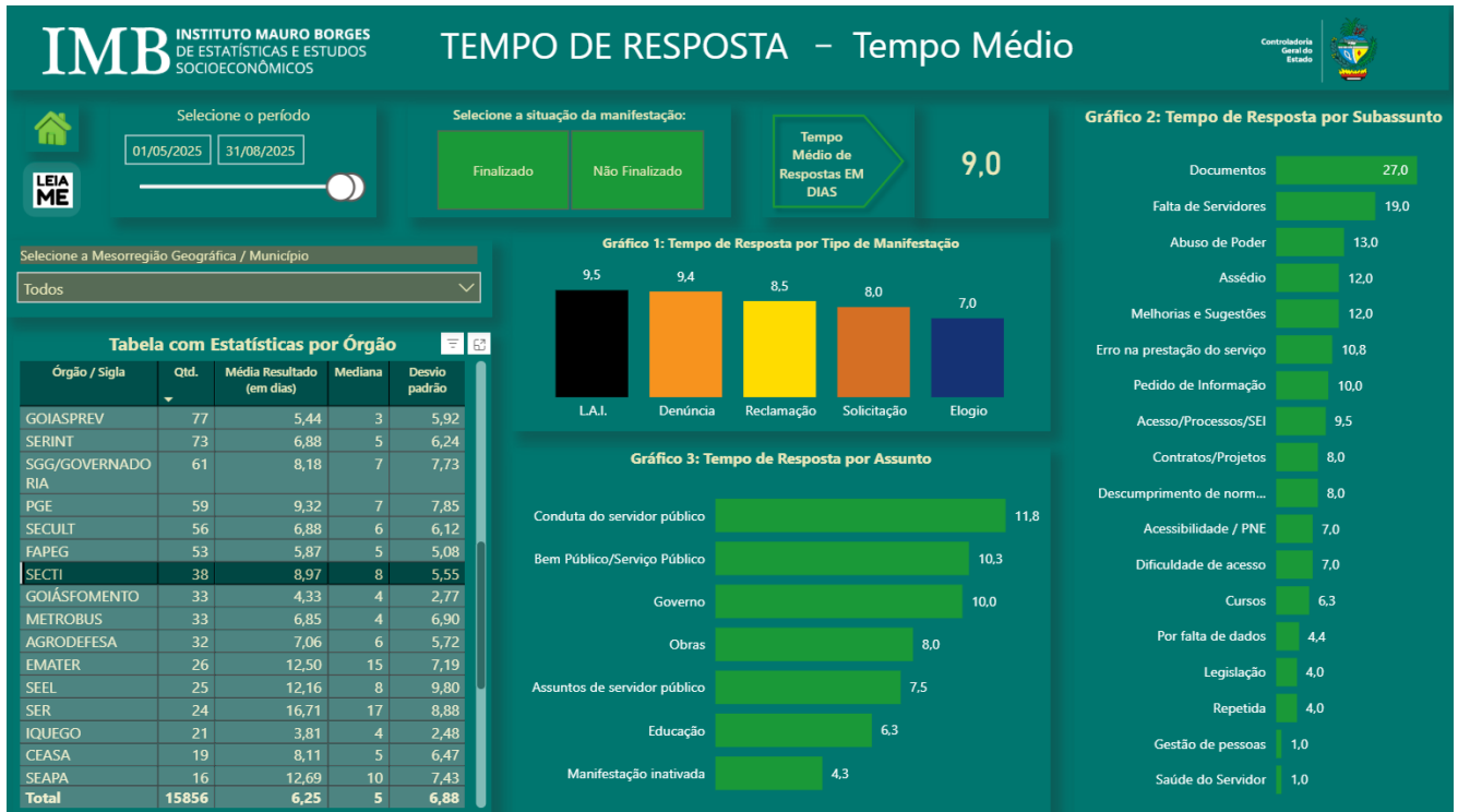
Figura 2: Tempo Médio de Resposta/SECTI