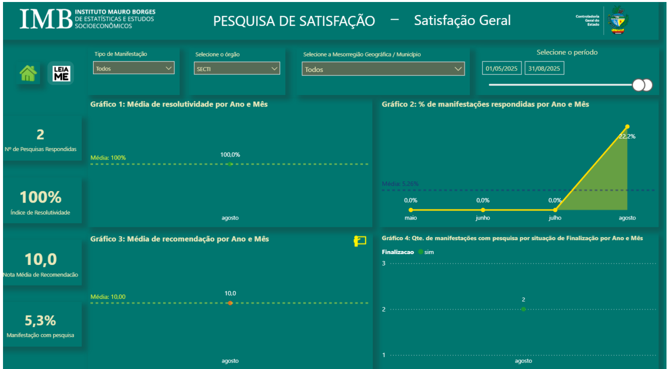
Figura 4: Pesquisa de Satisfação