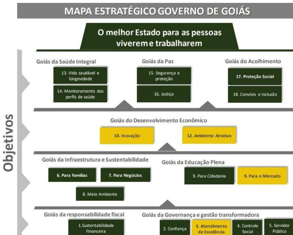
Figura 2 - Mapa Estratégico