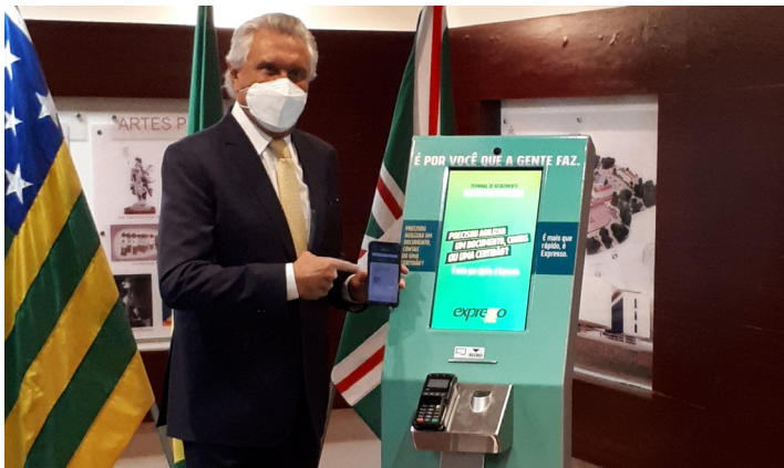
Governador Ronaldo Caiado mostra totem de autoatendimento