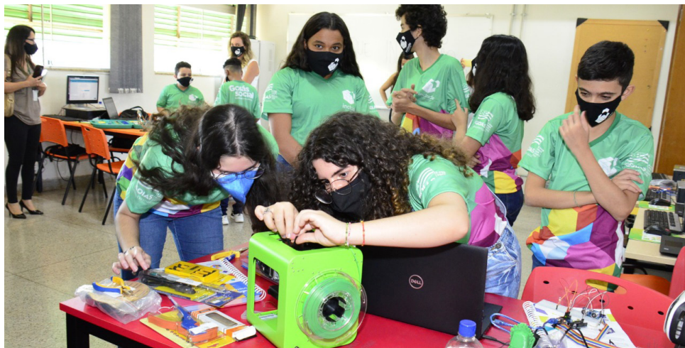
Jovens observam equipamentos do laboratório Include inaugurado na cidade de Luziânia

O governador Ronaldo Caiado inaugurou, no dia 13 de maio, mais dois laboratórios do projeto Include, uma parceria entre o Governo de Goiás, por meio do programa Goiás Social, e o Instituto Campus Party. As unidades estão na região do Entorno do Distrito Federal. O primeiro a ser entregue foi o do campus de Luziânia do Instituto Federal de Goiás (IFG). Em seguida, foi a vez da estrutura instalada na Casa da Cultura Mestre Sabá, em Valparaíso de Goiás. Ao todo, o governo estadual inves-