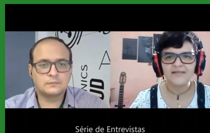
Série de Entrevistas