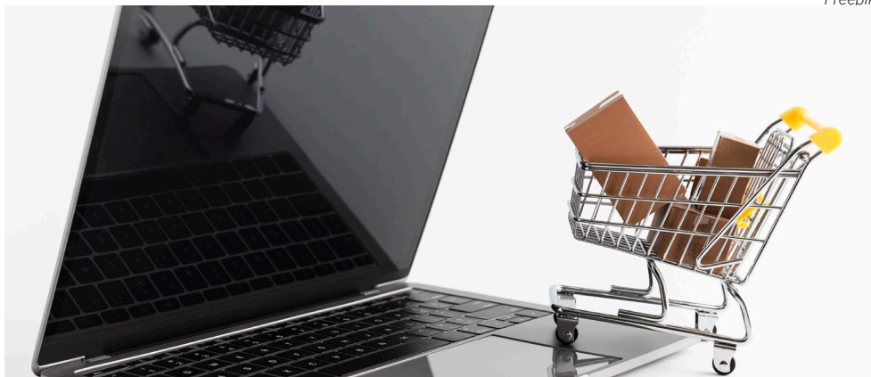
Pré-análise de processos ajuda na economia e evita duplicidade de compras de TI

Instituída por meio de decreto, a CACTIC é formada por seis servidores de carreira da STI. O grupo recebe a demanda de órgãos e agências