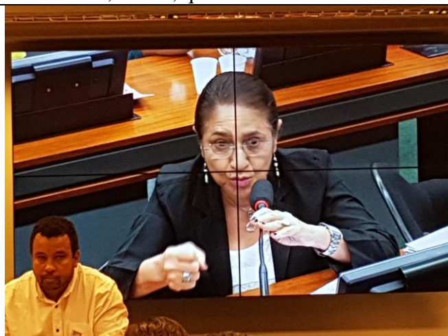
Foto acima a deputada Janete Capiberibe defende a Agricultura Familiar como fortalecimento das políticas públicas de SAN.

Foto acima a Presidente do CONESAN-GO, Dinair Furtado, afirma a importância da criação da Frente Parlamentar como instrumento de fortalecimento da SAN.