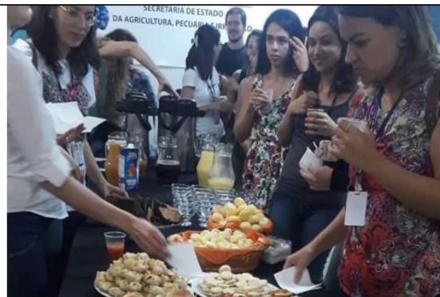
Momento da Segurança Alimentar e Nutricional