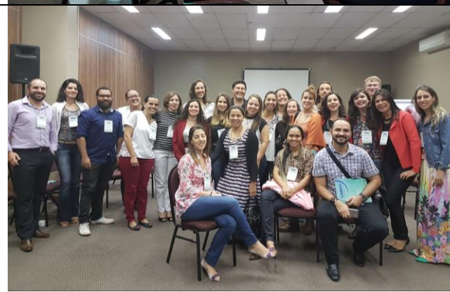
Foto acima registra oficina de trabalho durante o seminário.