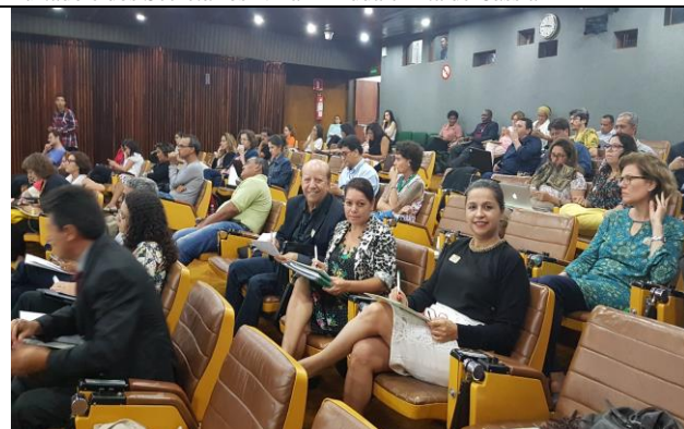
Vista geral de conselheiros estaduais na plenária, destacando os representantes do CONESAN-GO