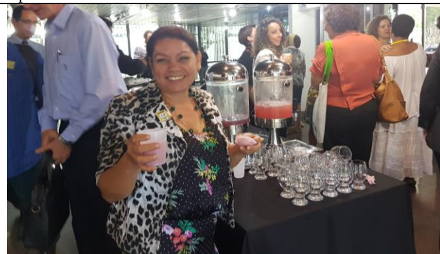
Momento de confraternização da Presidente Dinair Furtado no evento