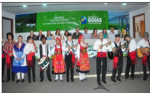
Acima, apresentação cultural do Grupo de Danças e Cantares Portugueses, Músicas e Danças do Norte de Portugal, que muito abrilhantaram o evento