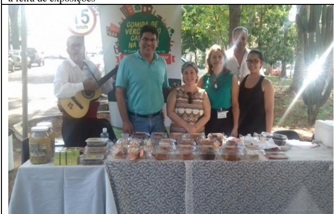
A feira de exposições foi contemplada com músicas do Grupo de Danças e Cantares Portugueses