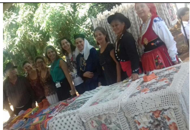
Exposição de artesanatos da feira animados pelo grupo de portugueses