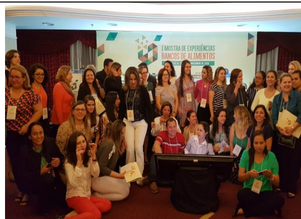
Foto de encerramento e confraternização dos participantes do evento.