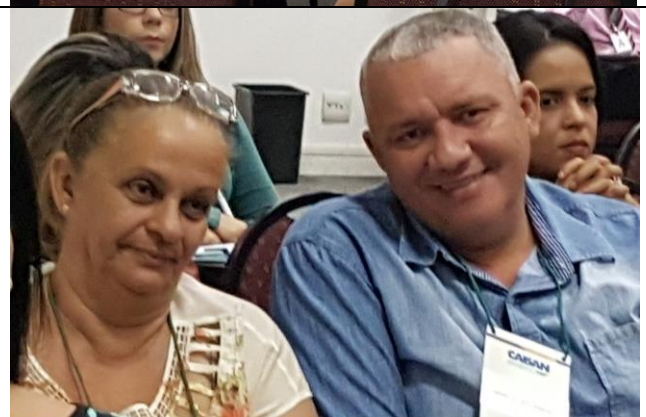
Foto acima representantes do COMSEA de Aparecida de Goiânia.