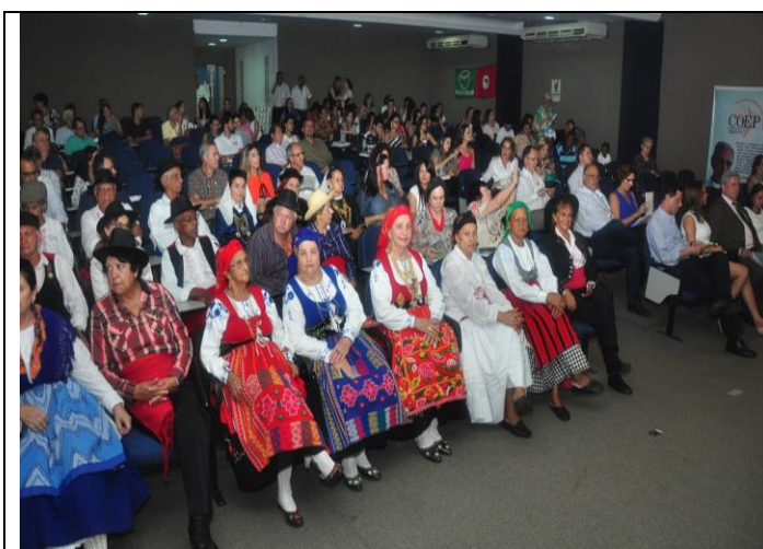
Um grande número de convidados participaram do seminário, de acordo com a foto acima..