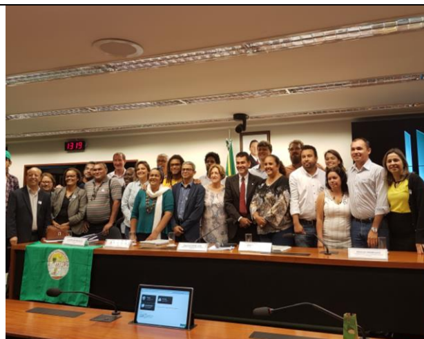
Foto acima momento de encerramento do Seminário.

Foto acima a deputada Janete Capiberibe defende a Agricultura Familiar como fortalecimento das políticas públicas de SAN.