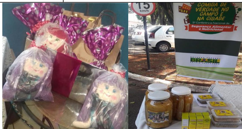
Acima brindes sorteados aos presentes