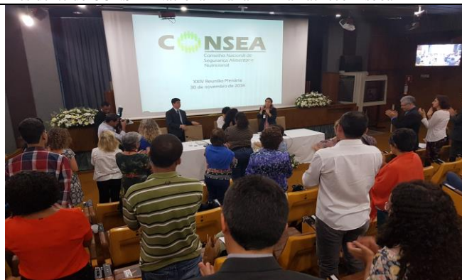
Vista geral da plenária, com a abertura do evento realizado pelo Secretário Nacional de SAN Caio Tibério Dornelles Rocha