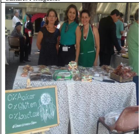
A feira de exposições foi contemplada com produtos adequados e saudáveis