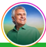
Ronaldo Caiado ✓ ⋮