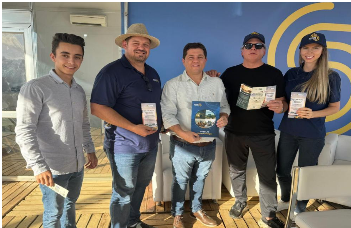
Atendimento a empresa Pneus Siqueira Campos, no evento Agro Brasília, onde foram sanadas dúvidas da empresa em relação aos incentivos fiscais. (22/05/2025).