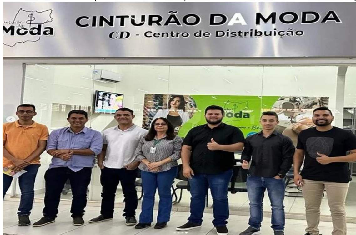
Atendimento a empresários do ramo de confecção do Município de Itapuranga, pleiteando a execução do Programa Cinturão da Moda no Município para qualificação da mão de obra. (12/03/2024).