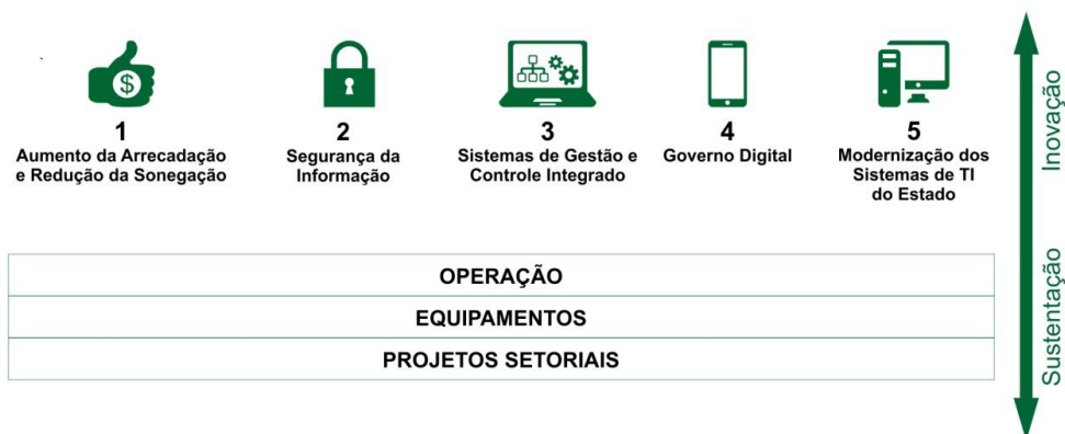
Figura 3 - Pilares estratégicos da TI