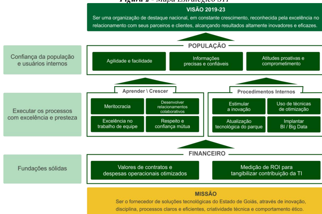
Figura 2 - Mapa Estratégico STI

A Figura 2 apresenta o Mapa Estratégico de TI da STI. A missão da STI é a base do mapa estratégico e têm como principal objetivo fornecer soluções de tecnologia da informação para os órgãos e entidades da Administração Direta, Autárquica e Fundacional do Poder Executivo do Estado de Goiás. Utilizando os recursos do contribuinte de forma otimizada, responsável e transparente, proporcionando excelência e clareza das atividades desenvolvidas na STI e por consequência, resgatando a confiança da população e dos usuários internos na STI.