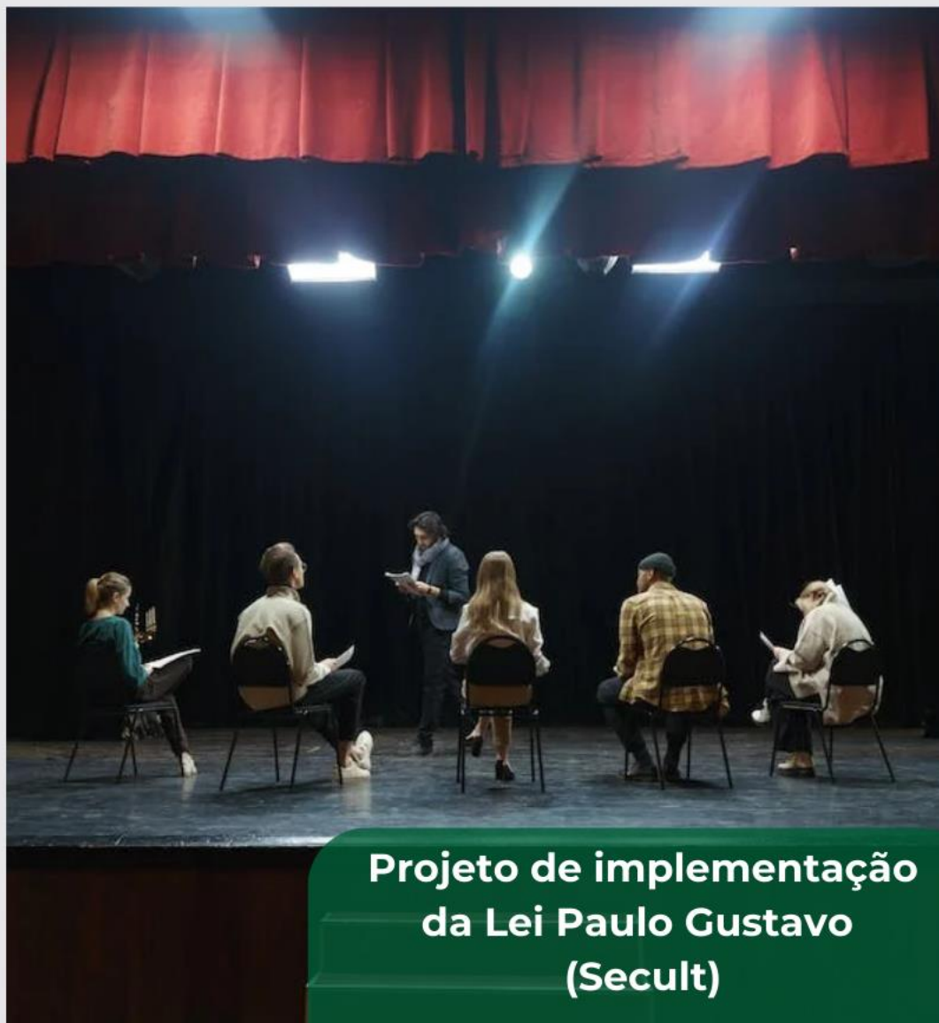
Projeto de implementação da Lei Paulo Gustavo (Secult)