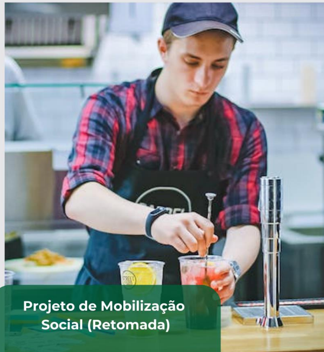
Projeto de Mobilização Social (Retomada)