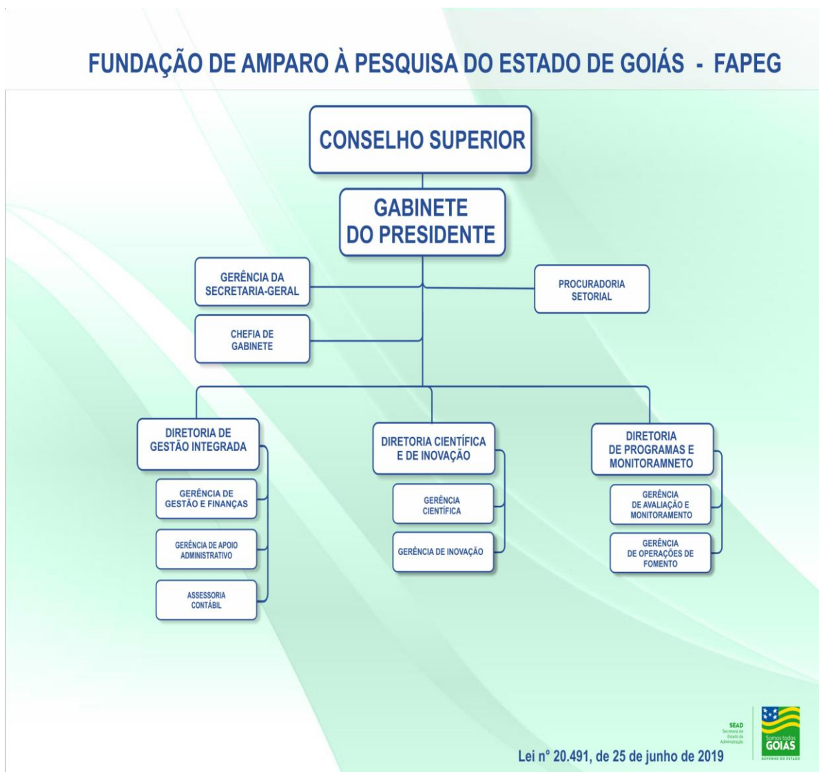
Figura 1 – Organograma da FAPEG