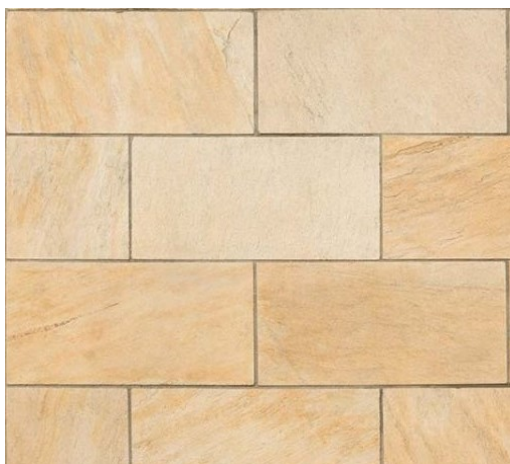
Pedra São Tomé