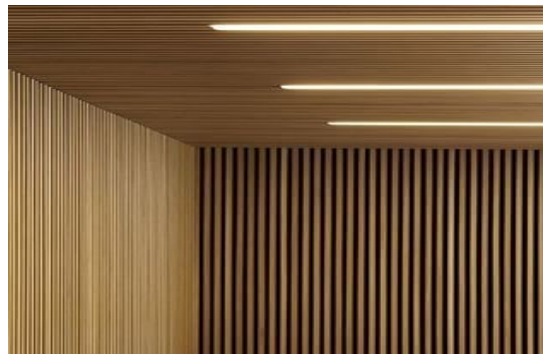
Forro Ripado em lambri de bambu ou Cumaru, Arauco ou equivalente