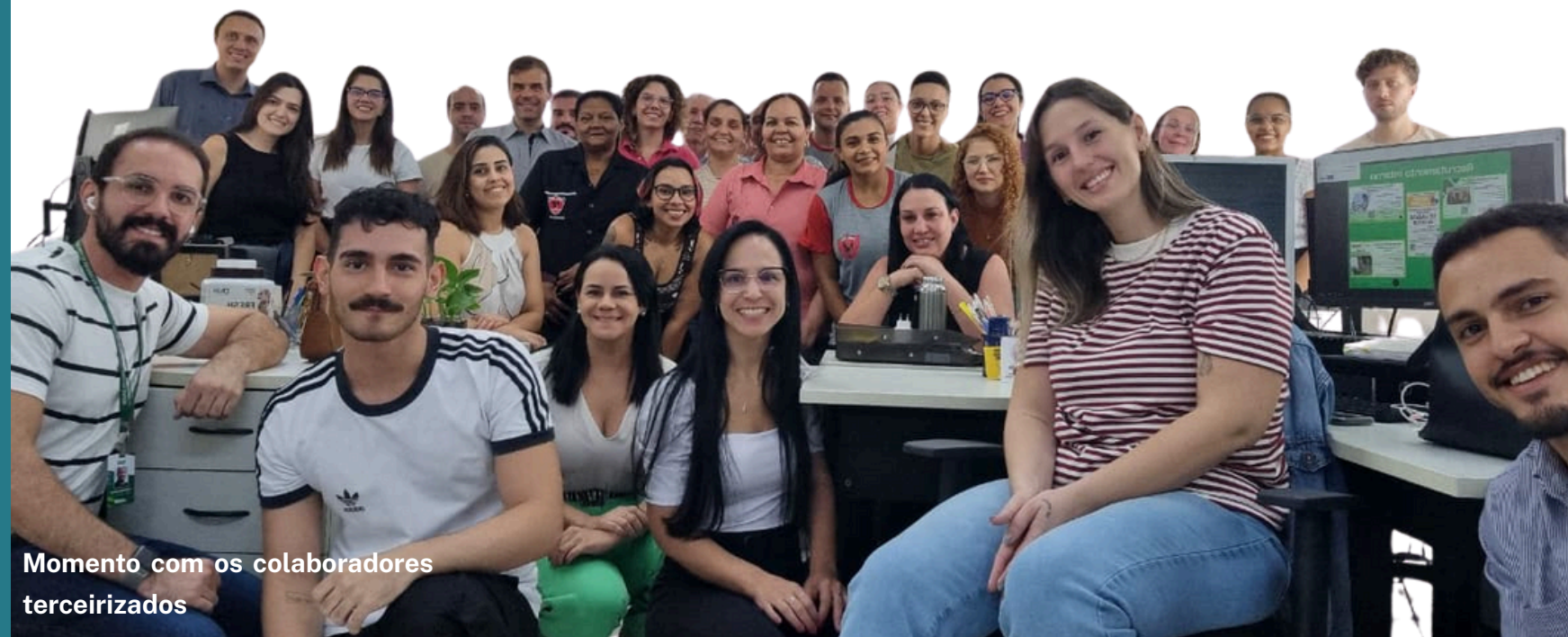
Momento com os colaboradores terceirizados

Essa abordagem humanizadora tem sido fortalecida por práticas concretas — desde momentos de integração com equipes que cuidam do dia a dia, como: limpeza, copa e manutenção e campanhas de conscientização até a implementação de espaços de desconpressão , como a hora de jogos nas sextas-feiras. Essas iniciativas demonstram que o equilíbrio entre desempenho, bem-estar e motivação é possível quando o foco está nas pessoas.