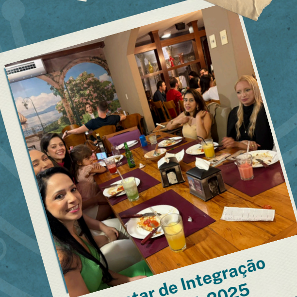
Jantar de Integração GPINFRA 2025