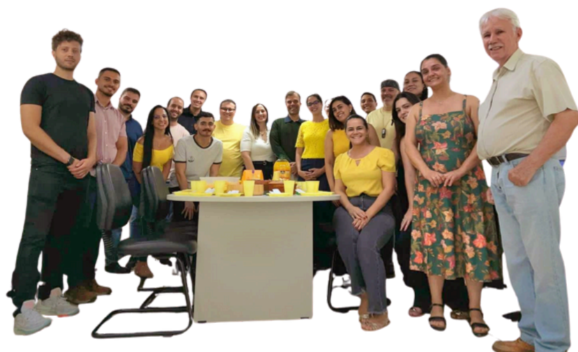
Campanha do Setembro Amarelo