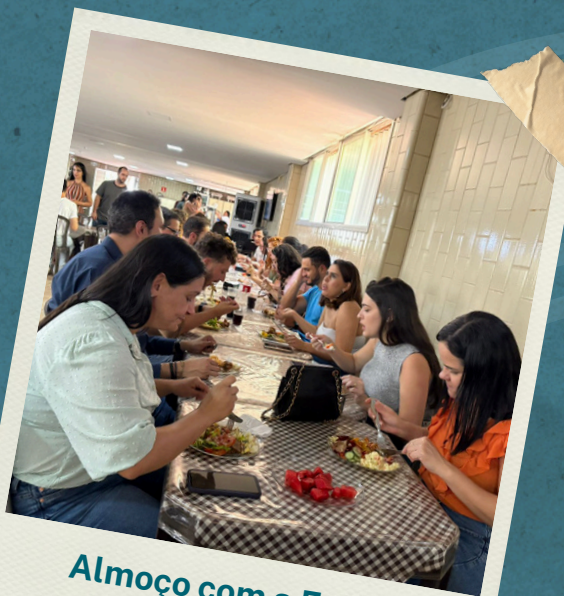
Almoço com a Equipe GPINFRA 2025