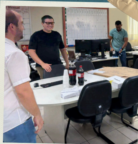
Capacitação com a Equipe GPINFRA 2025