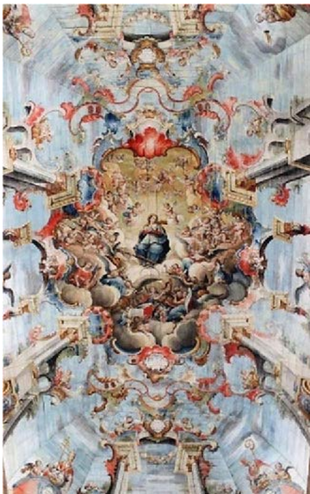
ATAÍDE, Manoel da Costa. Nossa Senhora rodeada de anjos músicos (1804). Forro da nave da Igreja de São Francisco, Ouro Preto.

Disponível em: < https://www.hacer.com.br/igreja-de-sao-francisco >. Acesso em: 4 ago. 2022.