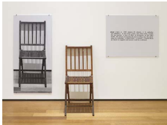
KOSUTH, Joseph. Uma e três Cadeiras [One and Three Chairs] (1965). MoMA Nova Iorque.

Disponível em: < https://www.moma.org/collection/works/81435 >. Acesso em: 4 ago. 2022.