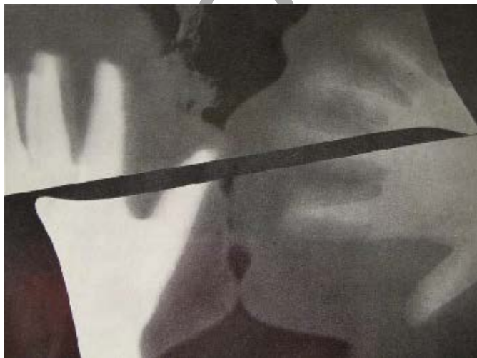
RAY, Man. O beijo (1922). MoMA.

Disponível em: < https://www.wikiart.org/pt/man-ray/raiografia-ou-fotograma-o-beijo-1922 >. Acesso em: 4 ago. 2022.