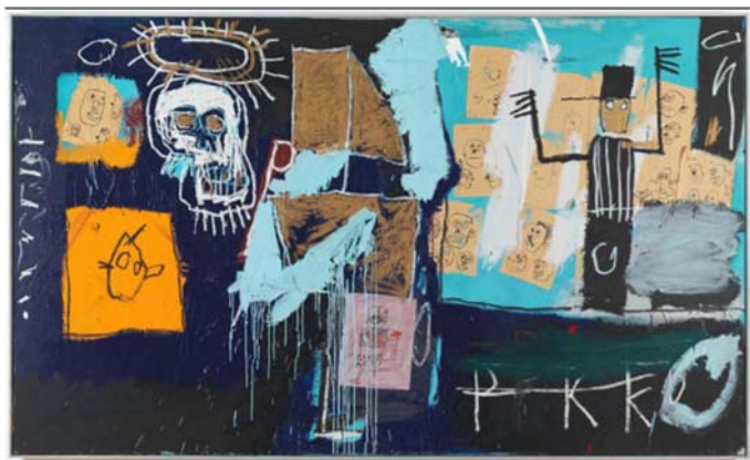
BASQUIAT, Jean-Michel. Slave Auction [Leilão de escravos] (1982). Musée National d'Art Moderne, Paris.

Disponível em: < https://www.centrepompidou.fr/fr/ressources/oeuvre/rPROJIS >. Acesso em: 4 ago. 2022.