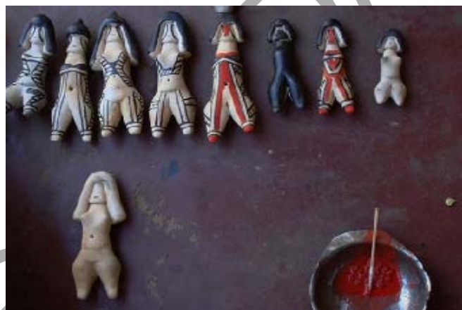
Fabricação dos bonecos ritxòkò modernos.

Disponível em: < http://portal.iphan.gov.br/pagina/detalhes/82 >. Acesso em: 4 ago. 2022.