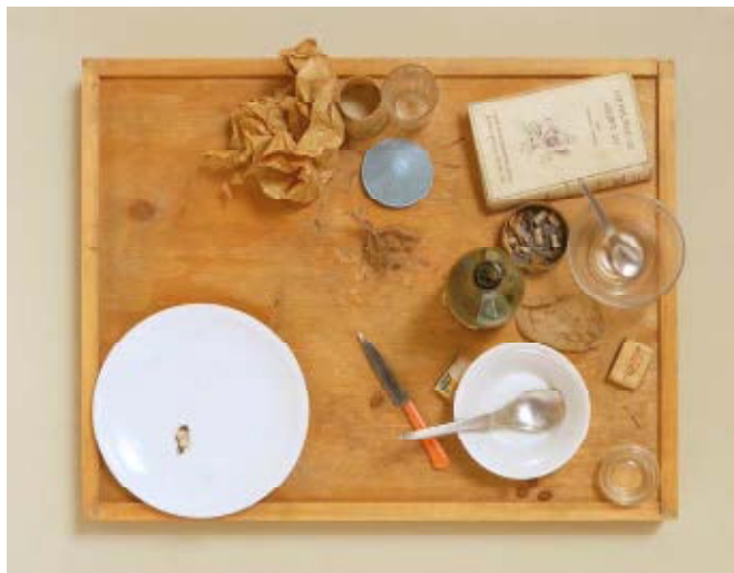
SPOERRI, Daniel. Poemas em prose [Poèmes em prose] (1959-1960). Tate Modern.

Disponível em: < https://www.tate.org.uk/art/artworks/spoerri-prose-poems-t03382 >. Acesso em: 4 ago. 2022.