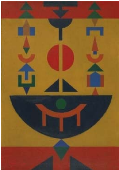
VALENTIM, Rubem. Composição 12 (1962). Óleo sobre tela, MASP.

Disponível em: < https://masp.org.br/acervo/obra/composicao-12 >. Acesso em: 4 ago. 2022.