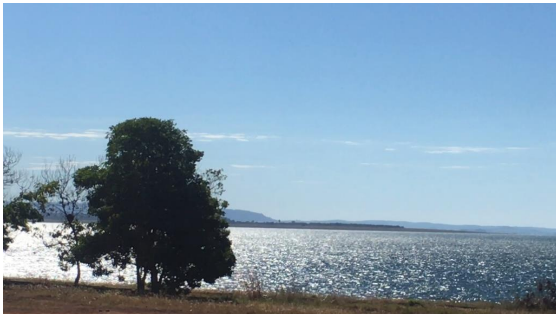
Figura 9. Represa de Furnas de Itumbiara, Goiás, durante o inverno de 2020