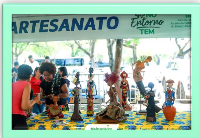
Figura 2 - Feira #NoEntornoTem

A Região Metropolitana do Entorno (RME), criada em 05/01/2023, encontra-se entre as que mais cresceram no Brasil, e juntamente com o Distrito Federal alcançou o terceiro maior aumento populacional em nível nacional, estando atrás apenas dos Estados de São Paulo e Rio de Janeiro, de acordo com Censo do IBGE divulgado em junho de 2023. Neste sentido, os atuais 11(onze) municípios que compõem a RME carecem de políticas públicas efetivas que atendam as demandas que sua crescente população apresenta, inclusive nas áreas de Cultura, Turismo e Empreendedorismo.