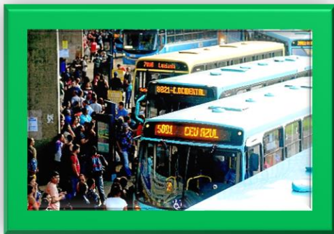
Figura 3 - Rodoviária Palmo Piloto

A Secretaria do Entorno do Distrito Federal (SEDF-GO), ao lado da Secretaria Geral de Governo (SGG), tem trabalhado pela melhoria do transporte público coletivo entre as cidades goianas do Entorno e o Distrito Federal