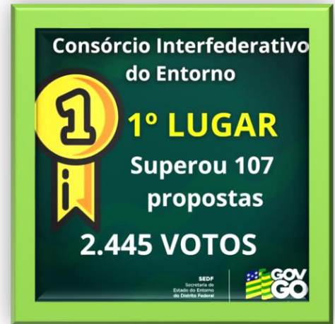
Figura 4 - Destaque Jornal O DESPERTAR

Em julho de 2023, o Governo de Goiás mobilizou e a população de Goiás votou no orçamento participativo do Governo Federal, via plataforma Brasil Participativo, para que a criação do Consórcio Interfederativo da Região do Entorno do DF fosse incluída nas metas do Plano Plurianual (PPA) do Governo Federal. Apesar de ter sido a proposta mais votada na categoria “Integração e Desenvolvimento Regional”, não foi incluída nas metas do PPA.