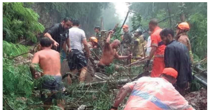
Motoqueiros socorrem cadeirante ilhada dentro do carro, clube de jazz acolhe 30 crianças por toda a madrugada, mulher leva de carona desconhecidos pra sua casa, amiga da amiga resgata crianças em ônibus... Confira estas e outras histórias!

Heróis anônimos: as muitas histórias de solidariedade na enchente