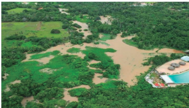
Chuvvas deixam 63 cidades do Maranhão em situação de emergência; mais de 7 mil famílias estão desalojadas

Chuvvas deixam 64 cidades do Maranhão em situação de emergência; mais de 7 mil famílias estão desalojadas