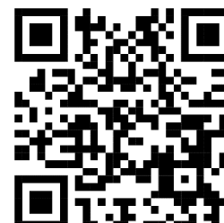
Hotel Beira Rio