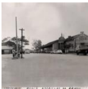
Estação Ferroviária Praça Americano do Brasil