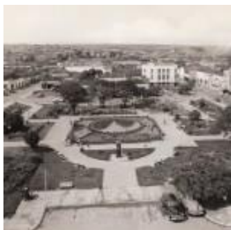
Praça Bom Jesus

Nascido em 1º de setembro de 1856, Zeca Batista está intimamente relacionado à história de Anápolis, para onde veio trabalhar como professor em 1882. Com a falta de médicos e farmacêuticos ele também exerceu tais atividades, além de atuar no comércio. Em 1907, construiu a casa que hoje abriga o Museu Histórico de Anápolis. Vários acontecimentos se deram nesse período em nível nacional como a abolição da escravatura e a proclamação da república e, em nosso município, o falecimento de Gomes de Sousa Ramos (1889). Zeca desfrutou em Anápolis e Goiás de grande prestígio. Faleceu em 7 de dezembro de 1910.