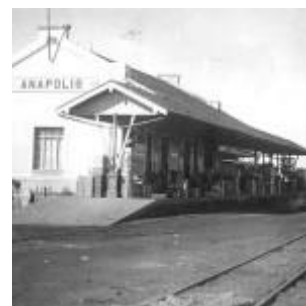
Estação Ferroviária em 1930