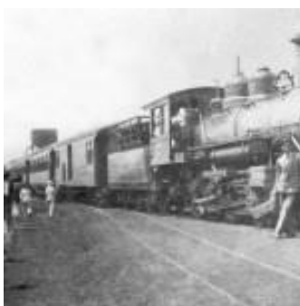
Primeiro trem de Anápolis