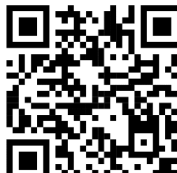
Hotel central de anápolis