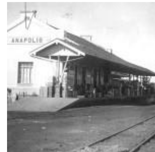
Estação Ferroviária em 1930