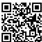
UPA DR. LINEU GONZAGA JAIME