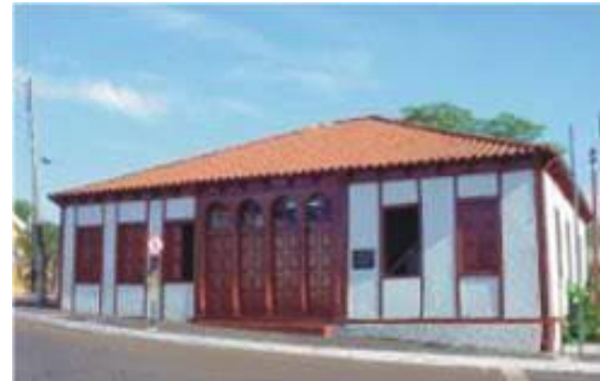
Museu de Arte Contemporânea