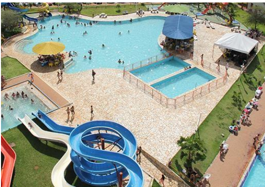
Clube thermas park