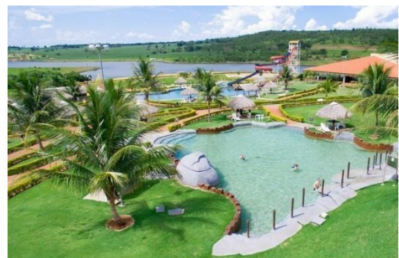
Hotel Thermas Bonsucesso