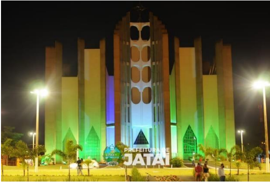
Catedral Divino Espírito Santo