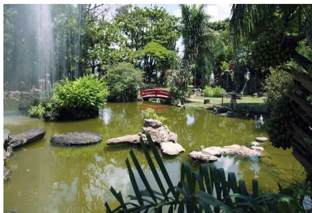
Jardim do Japonês