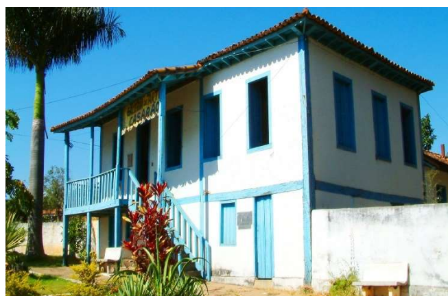
Casaão dos Gonzaga