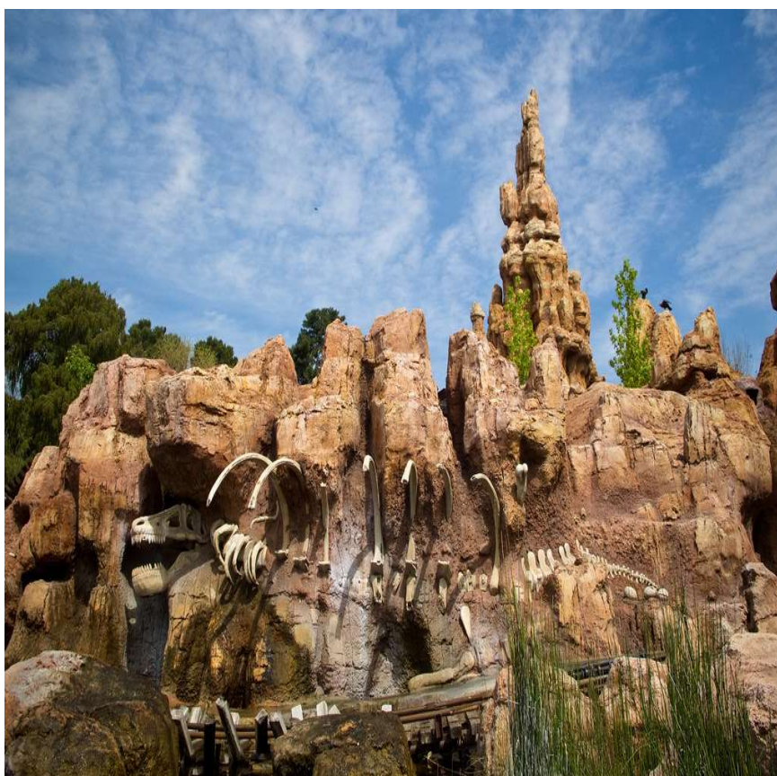
Clube Di Roma

Caldas Novas, cidade acolhedora e hospitaleira que recebe você de braços abertos. Sintam-se em casa!