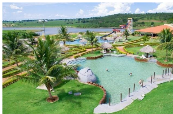
Hotel Thermas Bonsucesso