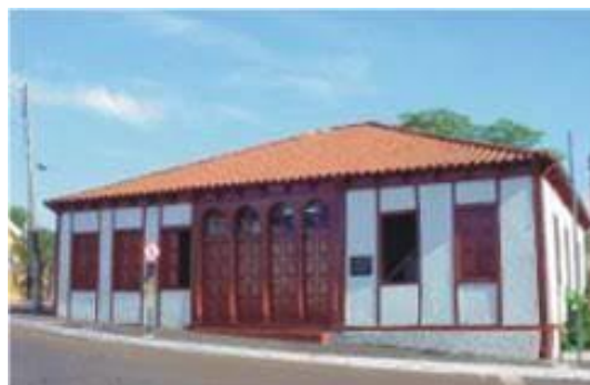
Museu de Arte Contemporânea