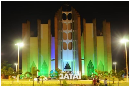
Catedral Divino Espírito Santo