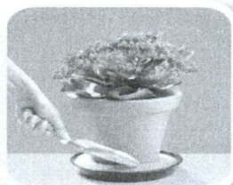
Coloque areia no pratinho dos vasos de plantas