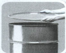
Feche bem tonéis e barris

Defenda sua família, seus vizinhos, sua comunidade. Não basta combater o mosquito. Precisamos eliminar seus criadouros e qualquer local ou recipiente que acumule água parada.