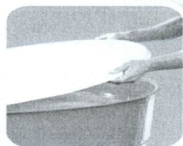
Tampe caixas d'água