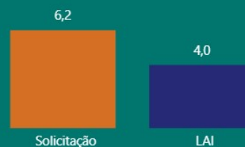
Gráfico 3: Tempo de Resposta por Assunto

Gráfico 1: Tempo de Resposta por Tipo de Manifestação