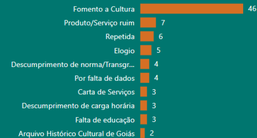
Gráfico 3: Qtde. de manifestações por Subassunto