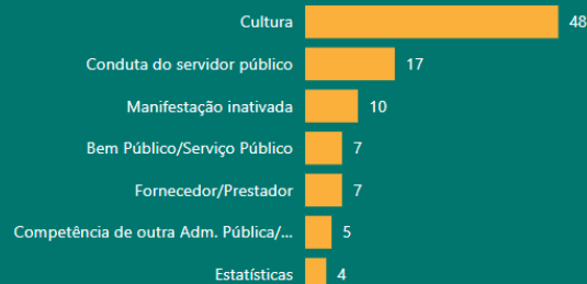
Gráfico 2: Qtde. de manifestações por Assunto